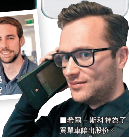
希爾-斯科特為了買單車讓出股份。