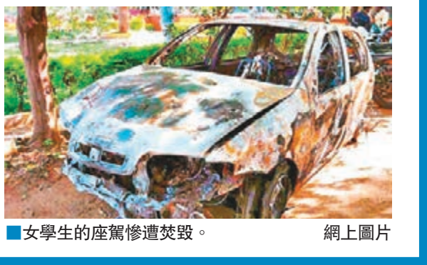
女學生的座駕慘遭焚毀。

暴民群起施襲，放火燒毀女學生駕駛的汽車，又毆打她和她朋友，並扯去她上衣，亦有報章稱她被剝去全身衣服，但遭性侵犯。女學生曾嘗試登上巴士離開，但乘客把她推出車外。她到醫院求醫時，又因失去銀包沒錢付醫療費被趕走，最終要向坦桑尼亞領事館求助。另有報章指，女學生遇襲後曾向警員求助，但對方以「你們黑人樣子差不多」為由拒絕施援。一行人到警署報案時亦遇到阻難，有