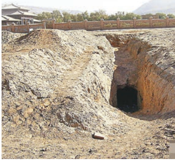
吐魯番阿斯塔那古墓。資料圖片

雖然考古無從證實這些餃子為古人春節飲食習俗，但很多學者認為，春節吃「餃子」習俗流傳已久。按照民間習俗，除夕夜的「子時」要放炮竹、吃餃子、辭舊迎新。由於除夕夜是兩年相交於「子時」，意寓「交子」。後來，人們就把「交子」時吃的這種美食，諧音稱為「餃子」。在不同朝代，餃子也有過不同的名字。比如在東周時被稱「餅餌」，隋朝時曾被稱「餛飩」，民間還曾稱「粉角」或「角子」。後來有很長一段時間稱之為「扁食」。