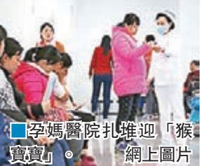
孕媽醫院扎擁迎「猴寶寶」。