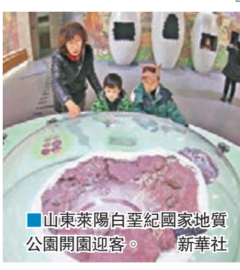
山東萊陽白堊紀國家地質公園開園迎客。