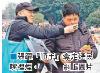
張躍「順手」奪走煙民嘴裡煙。

「小夥子，抽煙一點都不酷，反而會危害健康。」德陽文廟廣場上，一年輕小夥邊玩手机邊抽煙，突然被陌生老人打斷。