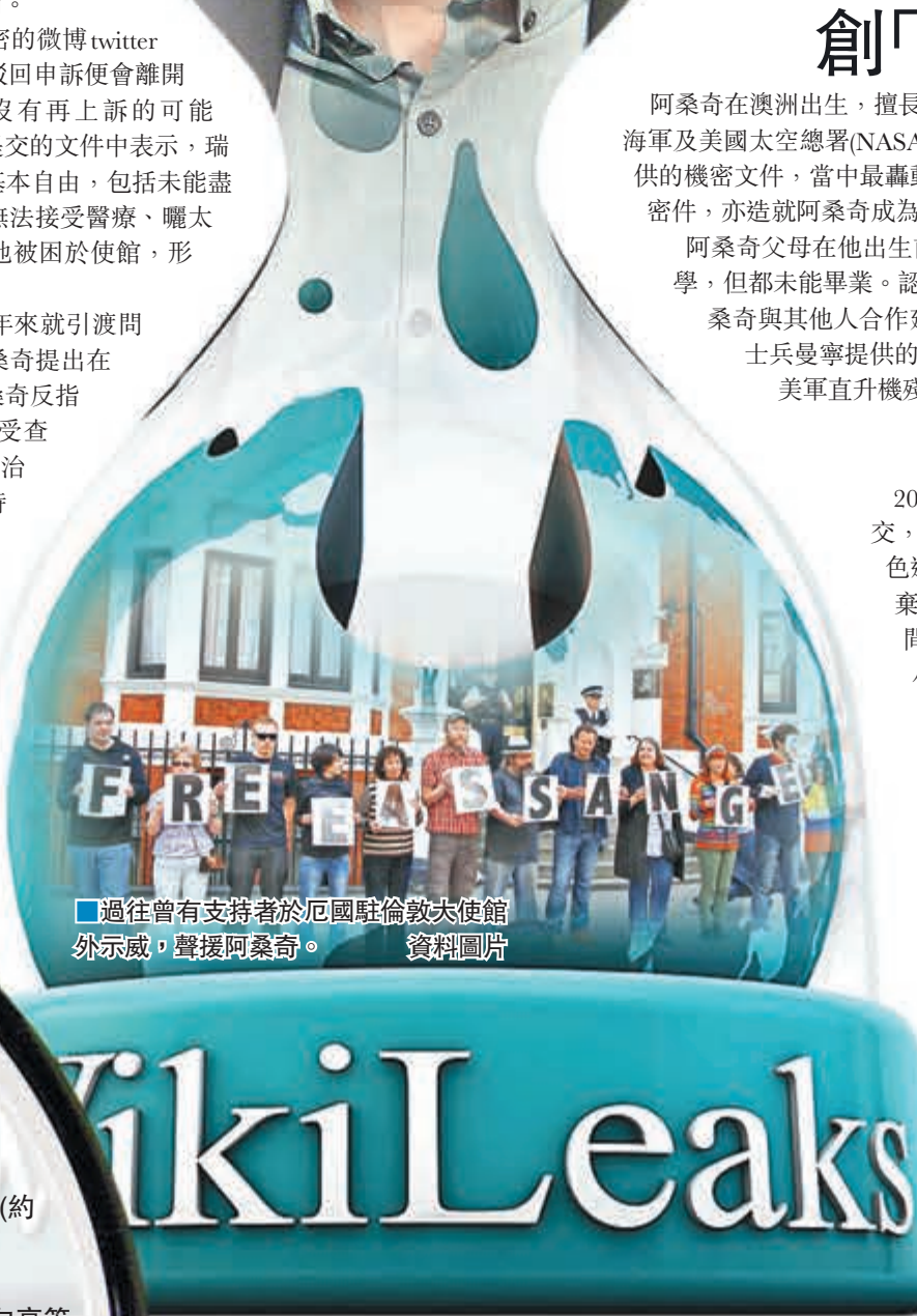
過往曾有支持者於厄國駐倫敦大使館外示威，聲援阿桑奇。資料圖片