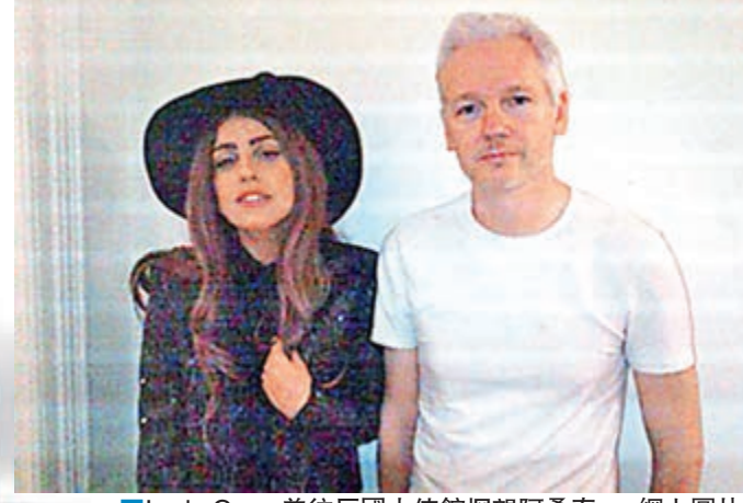
Lady Gaga曾往厄國大使館探望阿桑奇。網上圖片