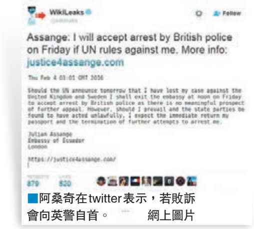
阿桑奇在twitter表示，若敗訴會向英警自首。

「維基解密」創辦人阿桑奇為逃避美國追捕，過去3年半藏身厄瓜多爾駐英國倫敦大使館，僵局如今或迎來重大轉機。阿桑奇此前向聯合國申訴遭到非法禁錮，瑞典外交部昨日提前披露，聯合國的「任意拘留問題工作組」會在今日裁定阿桑奇申訴得直。阿桑奇昨日曾稱若工作組駁回申訴便會自首，相反若他勝訴，則希望取回護照並要求當局停止追捕，讓他重獲自由。