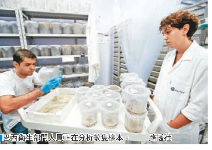
巴西衛生部門人員正在分析蚊隻樣本。