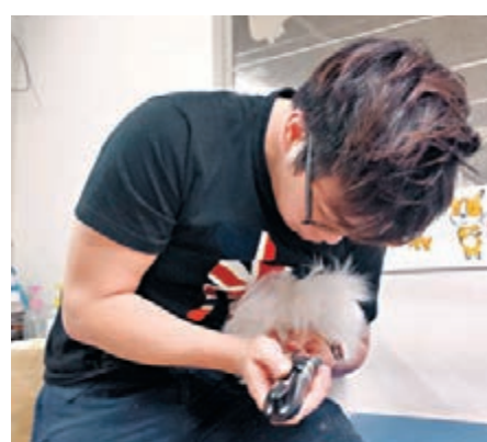
寵物美容師除了要幫寵物「扮靚」之外,還要兼顧店務。

坊間現時已有不少寵物美容師課程,但年輕人也可以選擇先做學徒:起初負責一些零碎執拾工作,當工作態度獲上司肯定後,便會學習使用電動剃毛器、剪趾甲、甚至洗澡、吹毛等工序,學懂這些基本上已可獨立提供服務。至於剪毛及設計屬進階技術,可往後再考慮進修。學徒薪水最初當然較微薄,但完成學徒訓練後薪金