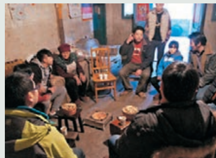
港生深入山區並到訪一名中一女孩位於山區的家。

香港文匯報訊(記者 高鈺)嶺南大學社區學院及持續進修學院上月舉辦一連7日的「四川雅安服務學習團」,與內地學生攜手進行義教及服務,同時透過山區探訪,讓港生能更多認識貧困童童的生活,學習感恩的心並回饋社會。