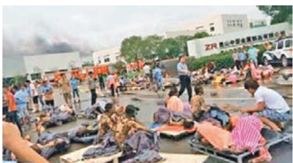
江蘇昆山「8·2」爆炸事故現場慘烈。本報江蘇傳真