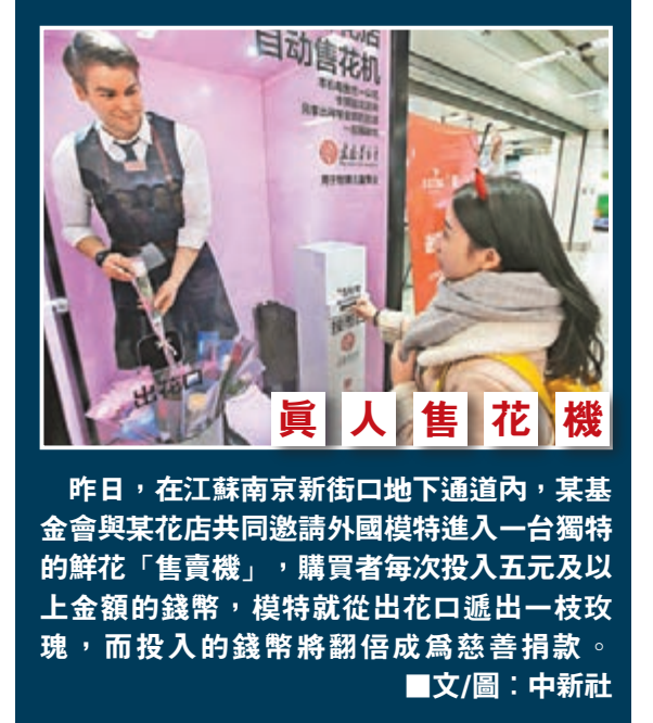
昨日，在江蘇南京新街口地下通道內，某基金會與某花店共同邀請外國模特進入一台獨特的鮮花「售賣機」，購買者每次投入五元及以上金額的錢幣，模特就從出口口遞出一枝玫瑰，而投入的錢幣將翻倍成為慈善捐款。

檢察機關在審查起訴階段依法告知了被告人趙黎平享有的訴訟權利，並詢問了被告人趙黎平，聽取了辯護人的意見。太原市人民檢察院起訴書指控：被告人趙黎平故意非法剝奪他人生命，致一人死亡；利用擔任內蒙古自治區公安廳廳長的職務便利，為他人謀取利益，非法收受他人鉅額錢款；違反規定非法持有槍支、彈藥；非法儲存爆炸物，依法應當以故意殺人罪、受賄罪、非法持有槍支、彈藥罪、非法儲存爆炸物罪追究其刑事責任。