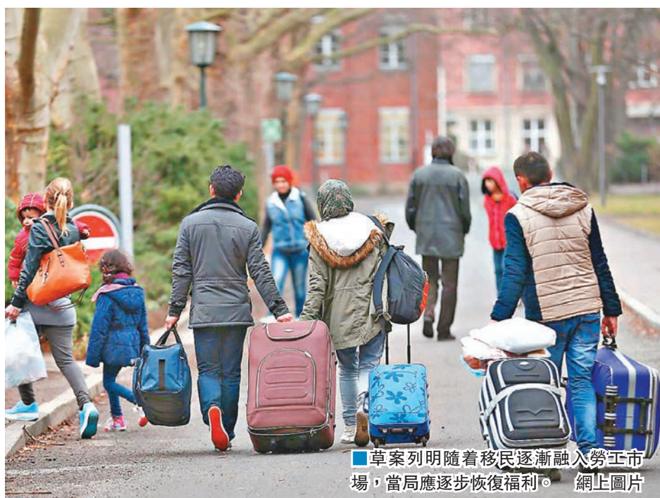
草案列明隨着移民逐漸融入勞工市場，當局應逐步恢復福利。