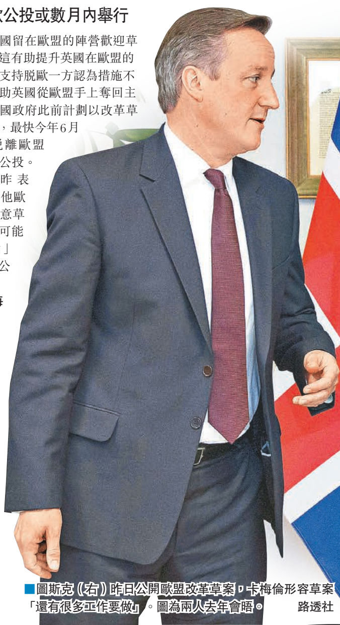
圖斯克(右)昨日公開歐盟改革草案，卡梅倫形容草案「還有很多工作要做」。圖為兩人去年會晤。