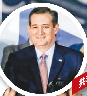
共和黨 克魯茲 親吻妻子慶祝先拔頭籌。