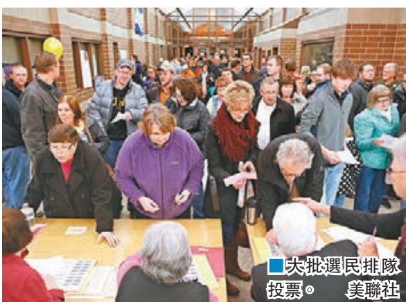
克魯茲:福音派捲票 攻陷「地面戰」