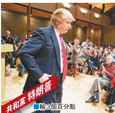
共和黨 特朗普 輸3個百分點