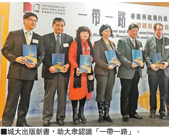
城大出版新書，助大眾認識「一帶一路」。

會?》，從多個角度分析「一帶一路」為香港帶來的機遇，對大眾認識這個國家的最新策略，將大有幫助。