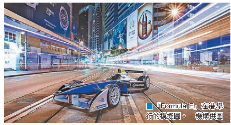
「Formula E」在港舉行的模擬圖。

將於10月在本港舉行的第三屆Formula E首站賽事，有10支車隊共20名車手參加，會於設在中環、全長2.2公里的賽道門快駛完30至50個圈。賽道位於中環海濱區，途經龍和道、天星碼頭及中環摩天輪等，全程設有10個彎位，在龍和道會有一段長555米的大直路，正式比賽約需個多小時。