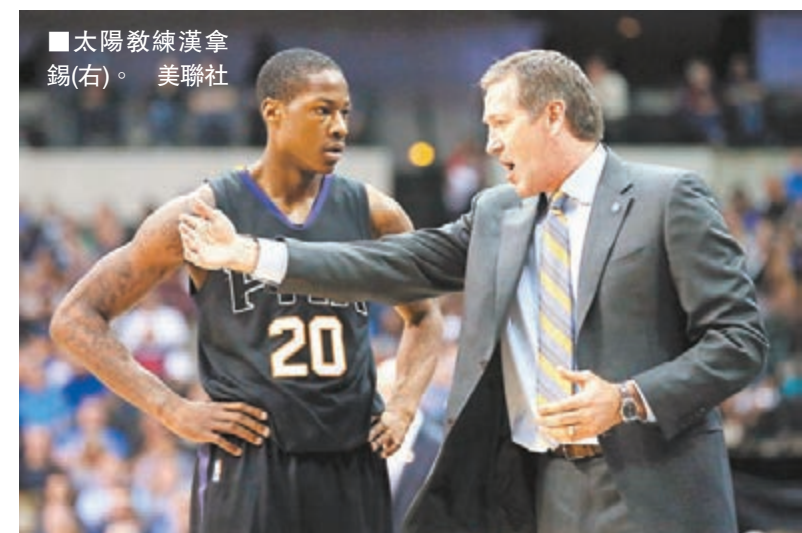
太陽教練漢拿錫(右)。

現年52歲的漢拿錫，是近幾年NBA崛起的優秀少帥代表，從2013至14賽季接過太陽教鞭，兩個半賽季以來帶領隊打出101勝112負的戰績，勝率為47.4%。