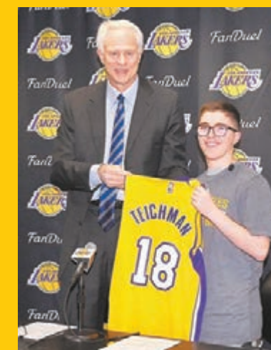
香港文匯報記者 梁啟剛

祖高域澳網6度稱王，大批塞爾維亞國球球迷聚集在中央球場前，揮舞塞國國旗共同歡慶榮耀時刻，甚至有自家媒體表態：「若祖高域出來選總統，所有人都會把票投給他！」對此人氣寵兒則謙稱，網球道路還很漫長，暫不考慮轉行，祖高域笑說：「身為運動員，我選擇留在球場上拼戰到底。」