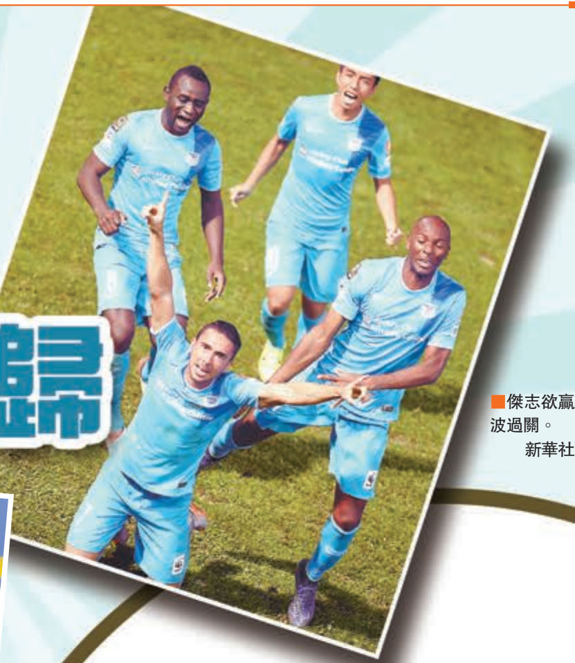
傑志欲贏波過關。