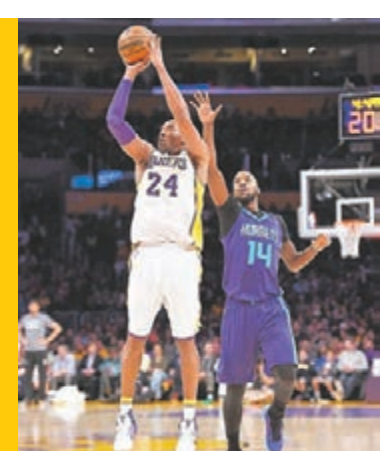
高比拜仁(左)跳投。