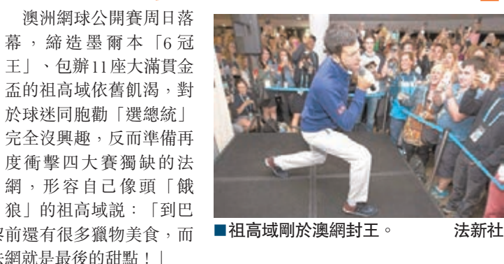
祖高域剛於澳網封王。

澳洲網球公開賽周日落幕，締造墨爾本「6冠王」、包辦11座大滿貫金盃的祖高域依舊飢渴，對於球迷同胞勸「選總統」完全沒興趣，反而準備再度衝擊四大賽獨缺的法網，形容自己像頭「餓狼」的祖高域說：「到巴黎前還有很多獵物美食，而法網就是最後的甜點！」