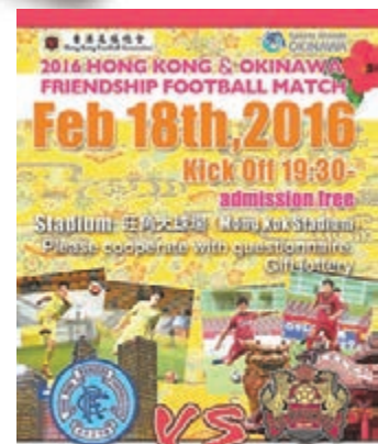
標準流浪再辦外隊訪港。流浪圖片

香港文匯報訊（記者 潘志南）面對降班威脅的港超聯老牌球會標準流浪，昨午透露會方將主辦外隊訪港友賽，比賽日期定於本月18日，對手為日本J3球隊FC琉球，賽事假旺角球場晚上7時30分上演，球迷免費入場，至於比賽更多詳情內容，包括客軍陣中球星等資訊，標準流浪將透過新聞發佈會公佈。這是標準流浪於兩年前主辦兩支西甲勁旅華倫西亞及維拉利爾訪港後，再一次為港球迷帶來另一份足球獻禮。