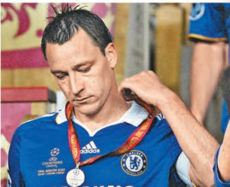
2008年歐聯決賽的「世紀跳腳」，成泰利職業生涯的污點。資料圖片