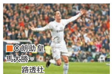
C朗助皇馬大勝。

皇家馬德里(皇馬)在球王C·朗拿度(C朗)締造其第29個西甲「帽子戲法」後，在主場大勝愛斯賓奴(愛奴)6:0，令前者只落後打少一場的榜首巴塞羅那(巴塞)4分。