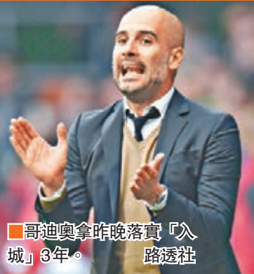
哥迪奧拿昨晚落實「入城」3年。

至於轉會窗關上前的最新消息，荷蘭中場尼祖迪莊跟AC米蘭解約後，便投效美職聯的洛杉磯銀河。紐卡素亦租借羅馬的科特迪瓦前鋒杜姆比亞半年。韋斯咸借用了費倫巴治的尼日利亞射手伊文歷基。 ■記者 鄭御龍