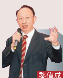
資深財經評論員 黎偉成