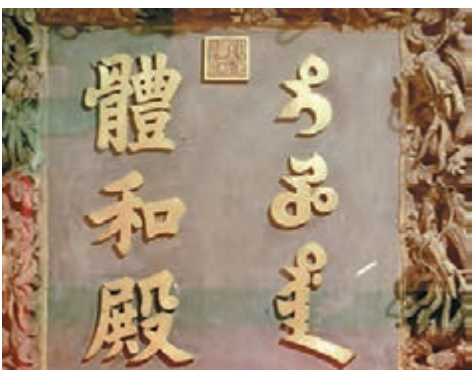
■ 體和殿的滿漢文並立匾額