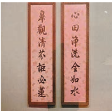
■ 清高宗行書七言聯