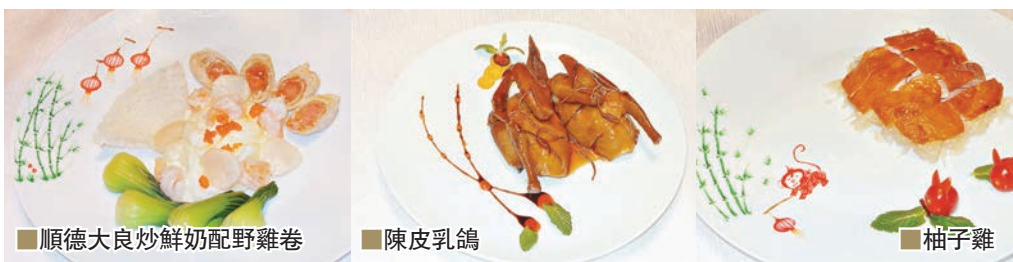
■ 順德大良炒鮮奶配野雞卷