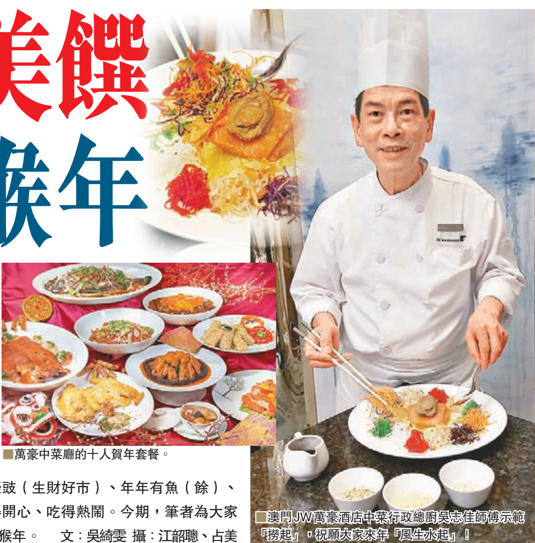
■ 萬豪中菜廳的十人賀年套餐。

今年，2月8日就是農曆新年了，先向大家送上衷心祝賀，祝願各位猴年「得心應手」、「一帆風順」，一同「送羊迎猴」！今天雖然只是年廿二，但相信大家都有着在「哪兒與一家人吃團年飯」，甚至新春後的開年飯，都是為新一年帶來好意頭，作為農曆新年的重要聚餐，餐廳、酒家的開年飯菜式豐富，菜牌寫滿了好意頭菜式：生菜蠔豉（生財好市）、年年有魚（餘）、生魚湯（生猛）、菜名讓人聽得開心、吃得熱鬧。今期，筆者為大家介紹一些賀年美饌，令大家齊齊喜迎猴年。 文：吳綺雯