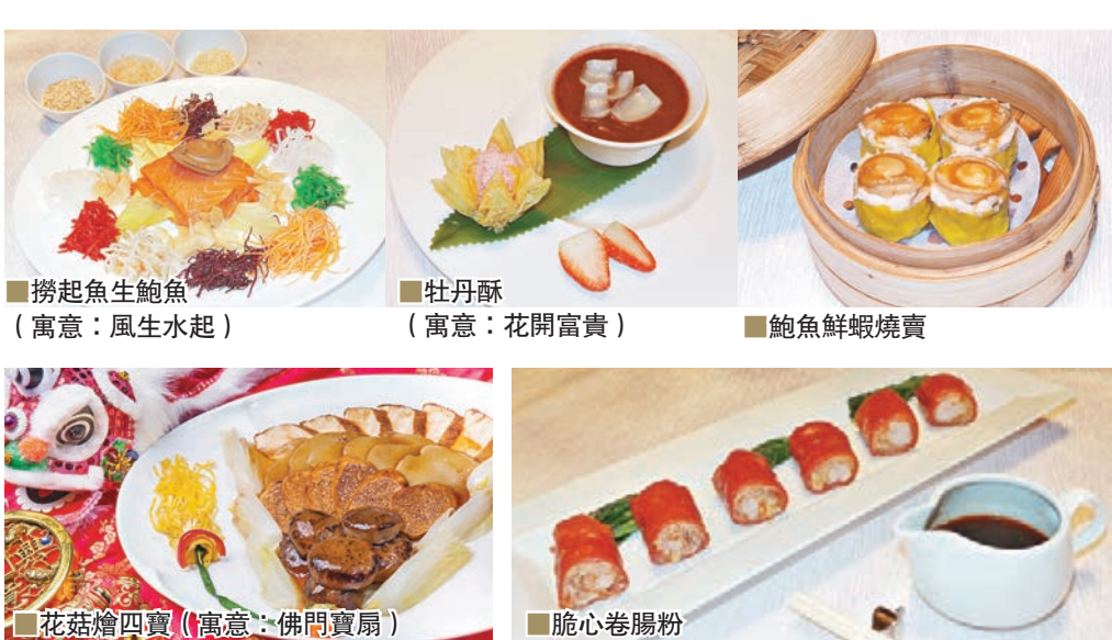
■ 撈起魚生鮑魚 (寓意：風生水起)

鮮美的珍貴花尾龍躉，更添滋味。龍躉魚皮飽含豐富膠質及維他命，是迎接新年的健康佳餚首選。十人套餐更可品嚐到經典賀年菜式 鴻運乳豬全體，寓意「紅袍添喜慶」，兩款喜慶賀年套餐由1月30日至2月22日期間供應。加上，多款滋味賀年小菜，以難忘的餐飲美饌體驗為大家喜迎新春。大受歡迎的賀年星馬菜式撈起三文魚生更是不容錯過。撈起碟上整齊排列着切條後的新鮮三文魚生，另一個碟上則放上紅蘿蔔及白蘿蔔等蔬菜絲。享用菜式時，大家可一同用筷子將兩個碟上的食材撈起拌勻，同時互贈恭賀說話，寓意「撈得風生水起」。而配有多汁鮑魚的鮑魚撈起魚生，則祝願大家「包你撈得風生水起」，其他特選小菜包括髮菜蠔瑤柱甫、花菇鮑片扣鴨掌、脆皮柚子雞等，滋味無窮。大家更可細嚐一系列意頭十足的巧手點心，當中牡丹酥外型活像一朵金黃牡丹花，象徵「富貴榮華」，內裡包着甜而不膩的蓮蓉餡。