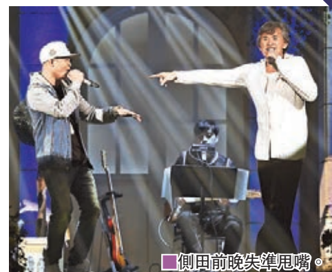
■ 側田前晚失準甩嘴。