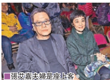
■ 張艾嘉夫婦是座上客。

要完花槍，兩夫婦便合唱一曲《選擇》，二人相擁合唱，阿Lam又吻沙麗臉龐，表現恩愛。至於阿Lam在懷念多位故友之時，亦數度感觸淌下男兒淚。