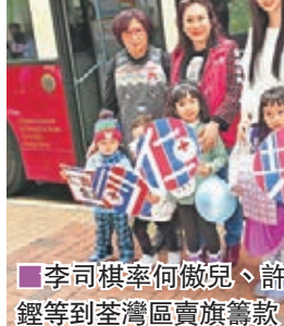
■ 李司棋率何傲兒、許廷鏗等到荃灣區賣旗籌款。

香港文匯報訊（記者李慶全）「仁濟醫院賣旗日」昨日舉行，仁濟慈善大使李司棋與仁濟慈善之星何傲兒及許廷鏗坐開蓬巴士到荃灣區賣旗籌款。