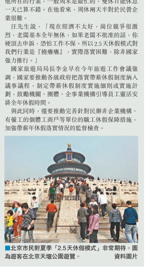
北京市民對夏季「2.5天休假模式」非常期待。圖為遊客在北京天壇公園遊覽。

國旅局：探索夏季周休兩天半 香港文匯報訊（記者 軼璋 北京報道）國家旅遊局局長李金早日前在2016年全國旅遊工作會議上提出，要推動地方和企業機構在保證每周法定40小時工作時、不影響群眾辦事的前提下，創造條件讓員工錯峰休假、彈性休息，探索夏季「2.5天休假模式」。對此，北京多位受訪市民表示「非常期待」，但不少市民亦擔心難以落實，希望國家能強力推動。 夏季「2.5天休假模式」是周五下午+周末的小短假調休方式，這是國家推動落實員工帶薪休假制度的一種積極探索。2015年3月5日，國務院總理李克強在政府工作報告中指出，「要深化服務業改革開放落實財稅、土地、價格等支持政策以及帶薪休假等制度。」2015年8月4日，國務院辦公廳印發的《關於進一步促進旅遊投資和消費的若干意見》，明確鼓勵彈性作息，有條件的地方和機構可根據實際情況，依法優化調整夏季作息安排，為員工周五下午與周末結合外出休閒度假創造有利條件。 京市民擔心落實難 供職北京某大型商業銀行辦公室的夏女士告訴記者，2.5天休假模式不錯，可以讓有更多時間陪伴自己兒子，倘若周五下午就休息了，也就意味着周末前移，對於去北京周邊省份遊玩時間上就相對充裕很多，比如去山西、內蒙、山東、河南，不管是自駕或選擇高鐵，時間上不會那麼「趕」了。 而供職中央某部委的陳女士表示，能多休息半天當然是好事，只是目前她所處的部門本就不是一個蘿莉一個坑，工作量大，相關公共服務也不是說關門就關門的，她認為落實會有困難。 希望國家強力推動 而供職某大型零售企業的汪先生則狂吐槽，國家推行周休兩天半看着很美好，但落實不容樂觀。比如他所在的行業，一般周末是最忙的，雙休日能休息一天已算不錯。在他看來，周休兩天半對於民營企業很難。 汪先生說，「現在經濟不太好，崗位競爭很激烈，老闆基本全年無休，如果老闆不批准的話，你硬頂去申訴，恐怕工作不保。所以2.5天休假模式對我們行業是『撓癢癢』，實際落實困難，除非國家強力推行。」 國家旅遊局局長李金早在今年旅遊工作會議強調，國家要推動各級政府把落實帶薪休假制度納入議事議程，制定帶薪休假制度實施細則或實施計劃，鼓勵機關、團體、企業機構引導員工靈活安排全年休假時間。 與此同時，還要推動完善針對民辦非企業機構、有僱工的個體工商戶等單位的職工休假保障措，加強帶薪休假落實情況的監督檢查。