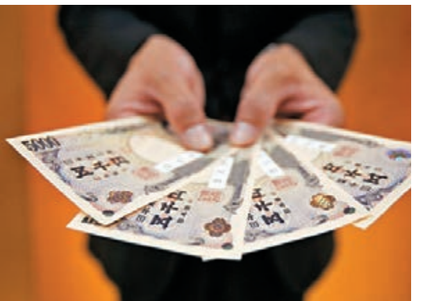
受日本央行實行負利率政策影響，昨天日圓匯價下跌。圖為日圓貨幣。

周四紐約2月期金收報1,115.60美元，較上日下跌0.20美元。現貨金價本週三受制1,128美元水平後遇到獲利沽壓，周四跌幅擴大，周五曾一度走低至1,108美元附近。美國周四公佈12月耐用用品訂單數據顯著弱於預期，但日本央行周五實施負利率行動，帶動股市上升，舒緩市場避險情緒，金價走勢反而略為偏軟，現貨金價周五大部分時間處於1,108至1,118美元之間。若果美國本週五公佈的第四季經濟表現一旦大幅遜於市場預期，則預料現貨金價將反覆重上1,120美元水平。