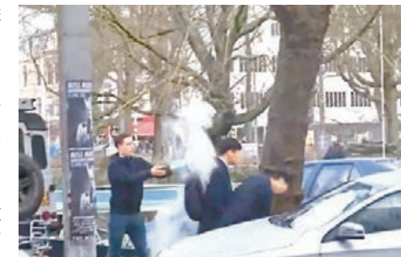
一名荷蘭青年向華人潑奶粉。

香港文匯報訊 據新華網報道，針對日前發生的荷蘭青年向華人潑灑奶粉事件，中國駐荷蘭大使館27日表示：「我們對在荷蘭發生這樣的惡劣事件感到震驚，希望荷方依法處理並採取必要措施，避免此類事件再次發生。」