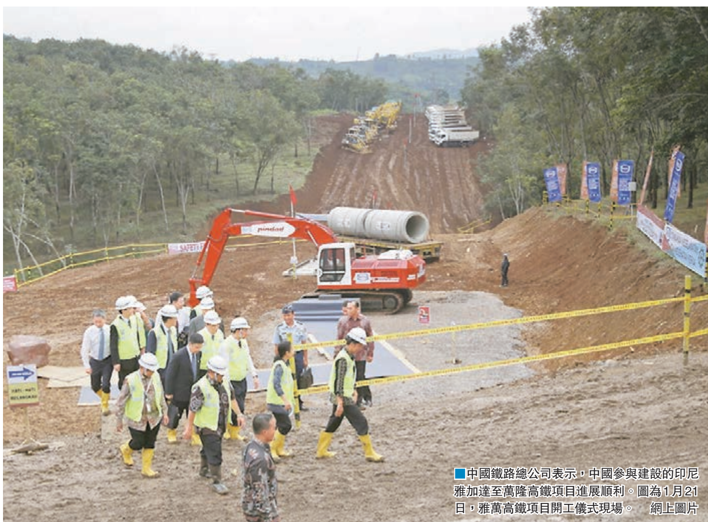
中國鐵路總公司表示，中國參與建設的印尼雅加達至萬隆高鐵項目進展順利。圖為1月21日，雅萬高鐵項目開工儀式現場。

據中通社報道，中國駐印尼大使館主管官員28日稱，隨著雅萬高鐵進入建設施工的新階段，中國和印尼的合資公司正與印尼政府主管部門就項目有關商業細節展開進一步協商。該官員表示，中國和印尼政府及其企業對於推進雅萬高鐵項目按期、保質建成的決心是明確的、堅定的。雙方一定會繼續誠信合作，共同按期、保質建成雅萬高鐵。他稱，雅萬高鐵項目從2015年3月開始洽談，到2016年1月21日正式動工，前後僅10個月，與國際上類似大型基建項目相比，速度超出預期，進展總體順利。雅萬高鐵全長150公里，連接印尼首都雅加達和第四大城市萬隆，最高設計時速350公里，計劃3年建成通車。屆時，雅加達到萬隆間的旅行時間，將由現在的3個多小時縮短至40分鐘。雅萬高鐵項目由中國鐵路總公司牽頭組成的中國企業聯合體，與印尼國企聯合體共同組建的中印尼合資公司承建，是國際上首個由政府主導搭台、兩國企業對企業進行合作建設和管理的高鐵項目，也是中國高速鐵路從技術標準、勘察設計、工程施工、裝備製造、物資供應、到運營管理、人才培訓、沿線綜合開發等全方位整體走出去的第一單項目。