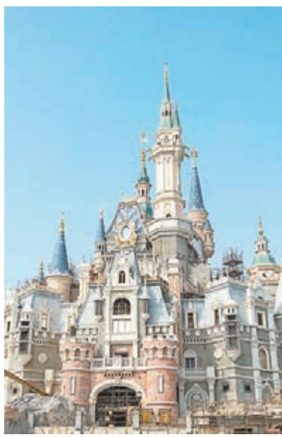
上海迪士尼樂園工程目前正在進行收尾。圖為建設團隊正為宏偉的奇幻童話城堡進行上色。資料圖片

此外，在今年內地房地產市場存在去庫存任務的背景下，楊雄先總結了上海樓市的2015年整體情況。去年上海新建商品房銷售達2,000萬平方米，二手房銷售達到3,000萬平方米。目前上海新庫房面積為1,000萬平方米，可在7個月內去化，不存在去庫存問題。楊雄亦表示，過去的兩年中房地產市場波動較大，上海仍將實行限購，不過在供應結構上要做些調整，多增加一些中小戶型的供應量，總體目標還是求穩。