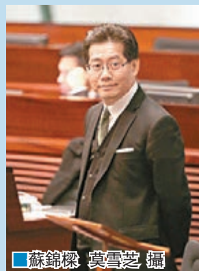
■蘇錦樑 莫雪芝 攝