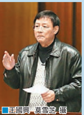
■王國興 莫雪芝 攝