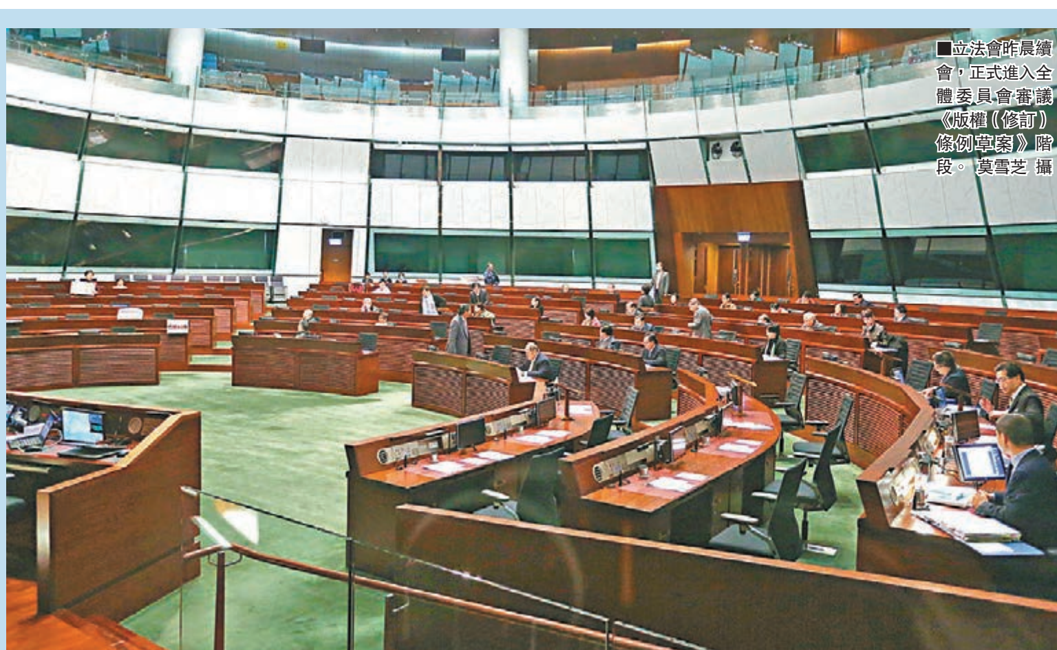
■立法會昨晨續會，正式進入全體委員會審議《版權（修訂）條例草案》階段。

但是，反對派已揚言繼續「拉布」，「人民力量」陳偉業聲稱，已經準備多項「37A議案」，誓言會不惜一切阻止表決，若財委會「強行」通過，不排除會透過司法程序阻止工程。他又稱，梁國雄計劃在會議上向陳健波提出不信任動議。