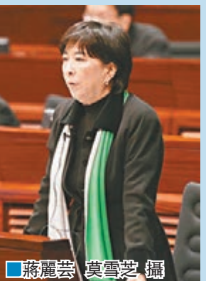
■蔣麗芸 莫雪芝 攝