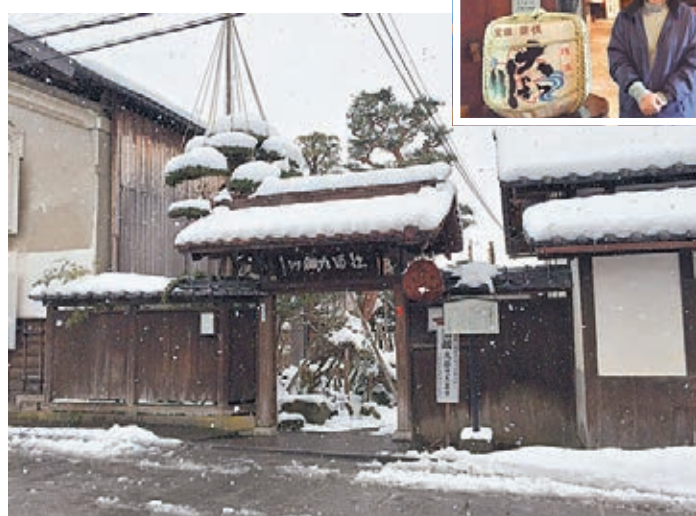
■ 大和川酒藏北方風土館門口