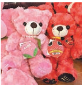
■ 福島熊仔可在鶴城會館內購買