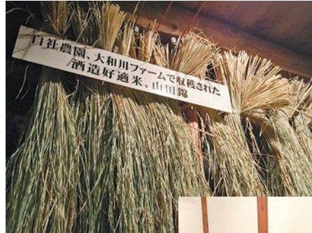
■ 釀酒最好的米——山田錦