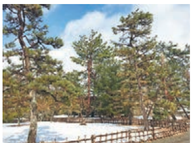
■ 雪中的鶴樓公園，有一份淒美感。