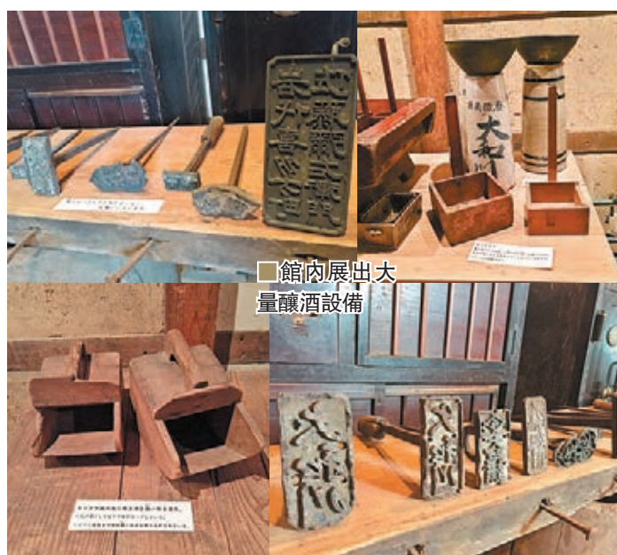
■ 館內展出大量釀酒設備