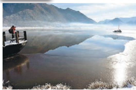
■ 冬日神農架大九湖