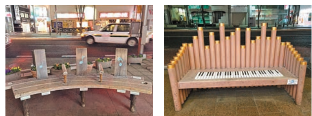
■ 標示了音符的街頭椅子

筆者由東京站，搭乘鐵路到郡山站，是福島の其中一個城市。在這個市裡，筆者悠閒地在街上走走，不期然下雪了，為之雀躍。看到路旁的椅子，有的鋼琴形狀，有的在椅子上刻了音符，感覺街上充滿了音樂感。椅子上鋪了點雪，更有一份寫意的感覺。就在同一條街上，你突然又發現了郡山的山道史，一座山水道屹立在路邊，細心看原來是一座久遠了的歷史文物。