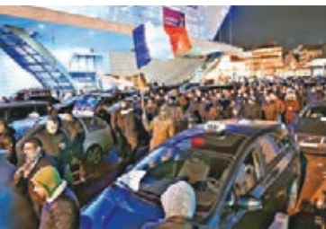
■巴黎的士司機連續第二日大罷工。