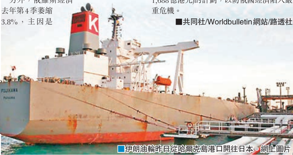
■伊朗油輪昨日從哈爾克島港口開往日本。網上圖片