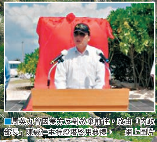
馬英九曾因為美方反對放棄前往，改由「內政部長」陳威仁主持燈塔啓用典禮。