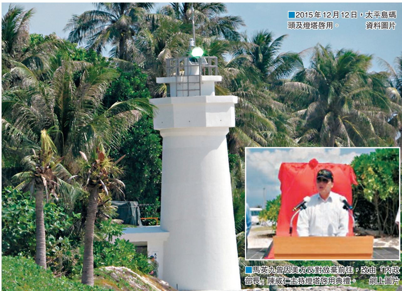
2015年12月12日，太平島碼頭及燈塔啟用。資料圖片