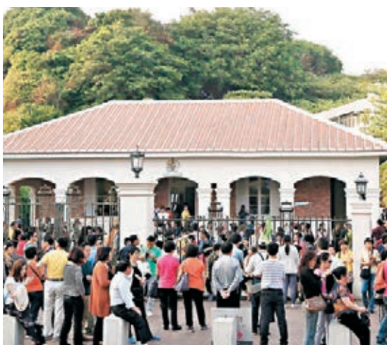
馬曉光澄清，「大陸有關方面從未對大陸居民赴台旅遊設定配額。」圖為陸客參觀高雄文化園區。

次，同比增加4.73%。其中台灣居民來大陸549.86萬人次，同比增加2.47%。大陸居民赴台435.75萬人次，同比增加7.73%。預計全年大陸居民赴台旅遊達到340萬人次，再創歷史新高。