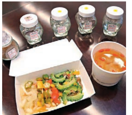
馬英九去年12月曾在臉書發圖「來自太平島的那盒菜」。