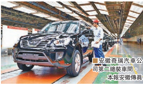
安徽奇瑞汽車公司第三總裝車間。

目標。作為中國第一家進入伊朗的乘用車自主品牌企業，奇瑞早在2004年就與伊朗莫迪蘭汽車製造有限公司合作，出口成套散件組裝整車。2009年奇瑞抓住市場機遇，成功收購莫迪蘭公司股權，成為最大股東。與此同時，奇瑞同步在伊朗當地建立本地化團隊，全面負責合資公司的經營和管理。目前，奇瑞在伊朗已擁有具備6萬台整車產能的工廠，擁有超過150家的銷售和售後服務網絡。