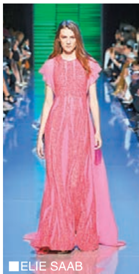
■ ELIE SAAB

踏入2016年，一連串節慶接連而來，女士也忙於為衣櫥添上新服裝，為充滿歡樂的新年作準備。Repetto今個春夏再次在調色板上着手，充滿喜慶感覺的紅色是節日必備顏色，更是中國人新年的代表顏色，無論女士或小朋友們都必要準備一對小紅鞋，增添節日氣氛。品牌特別為節慶紅色添上閃亮金屬面，為佳節增添甜蜜感覺，備有芭蕾舞平底鞋及尖頭鞋供選擇，讓舞者在節慶中散發嫵媚氣質。 ELIE SAAB將經典的女性魅力生動地演繹，幻化為成衣系列的一種意識形態，將珍貴元素注入日常服飾之中。其喱士及花卉圖案一直是品牌的精髓，融入全新剪裁，締造出大膽前衛的混搭風格。加上，新系列的設計色彩斑斕豐富，尤其玫瑰紅於不同服飾上互相碰撞，迸發出奪目自信。直線及網格圖案融入當季主打印花及喱士織布設計之中，並與經典捲葉紋圖案互相搭配，為服飾增添生動傳神的圖像感。