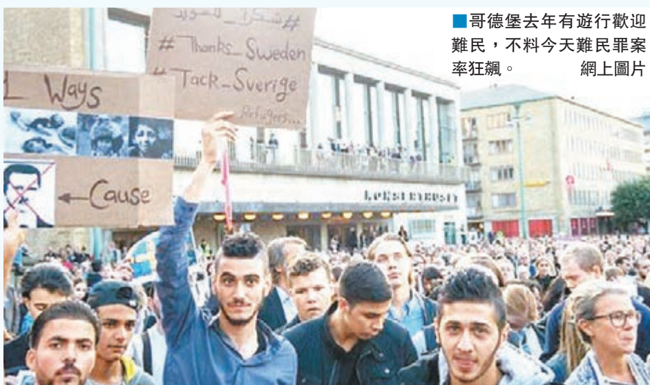
哥德堡去年有遊行歡迎難民，不料今天難民罪案率狂飆。