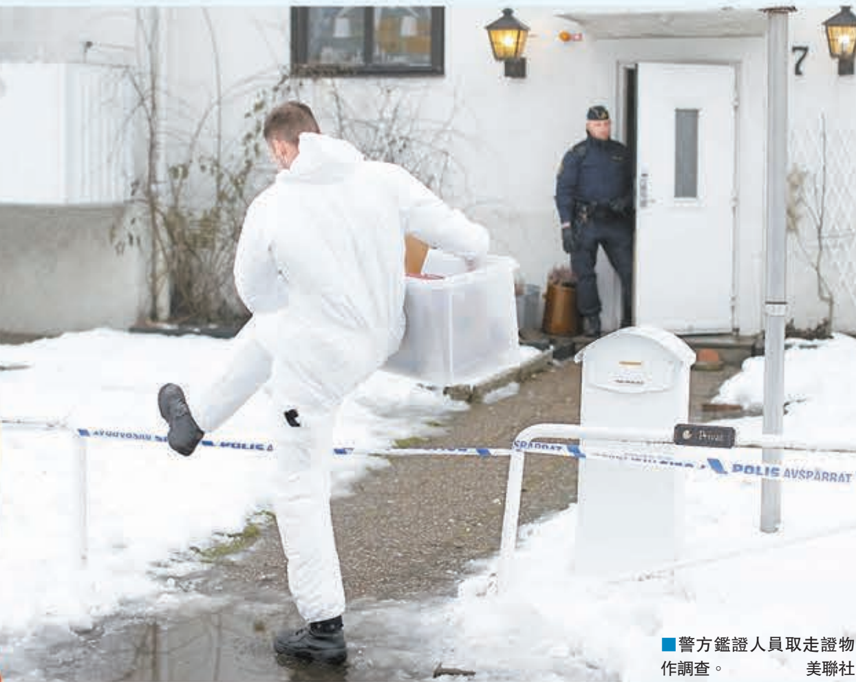
警方鑑證人員取走證物作調查。