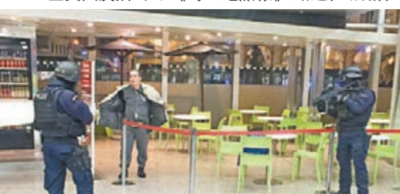
羅馬荷槍警員在火車站搜查一名男子。