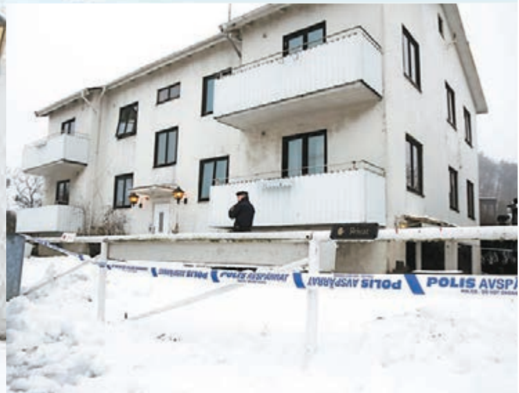
難民中心專收容14至17歲「孤兒」難民。