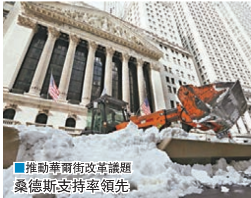
■推動華爾街改革議題 桑德斯支持率領先

美國總統初選選情繼續升溫，共和、民主兩黨下周一將於艾奧瓦州舉行黨團會議，象徵提名戰正式展開。美國有線新聞網絡(CNN)最新民調顯示，被視為民主黨參選人最熱的前國務卿希拉里，支持率已遭自由派對手桑德斯超越，落後對方2個百分點，意味她有機會在黨團會議出師不利，甚至重演2008年大熱倒灶的慘痛經歷。