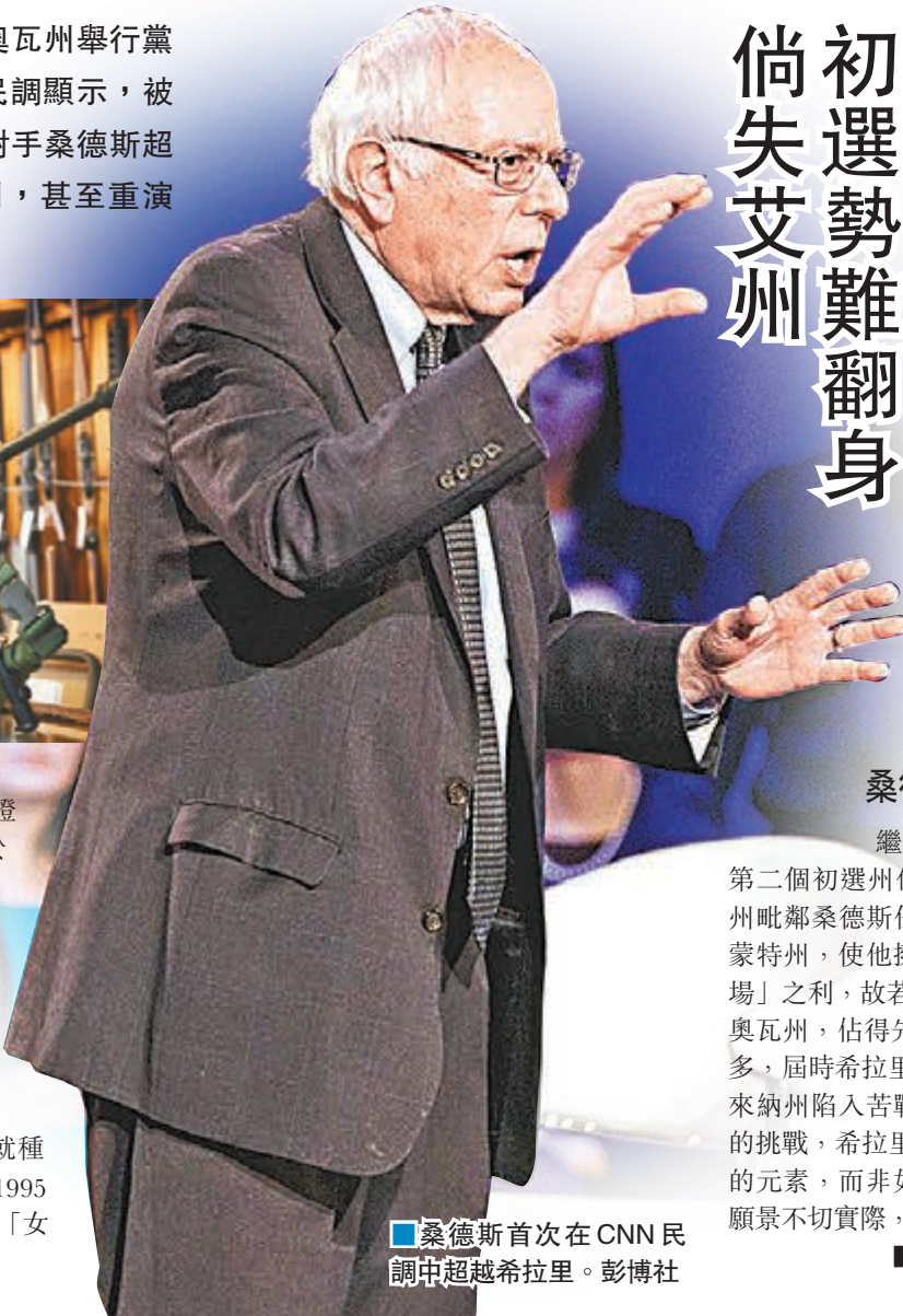
■桑德斯首次在CNN民調中超越希拉里。彭博社