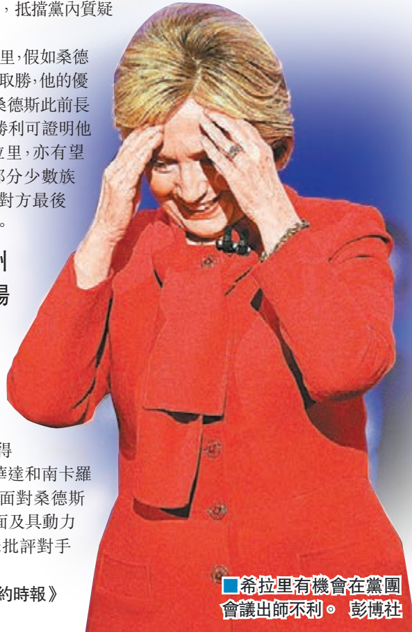
■希拉里有機會在黨團會議出師不利。彭博社