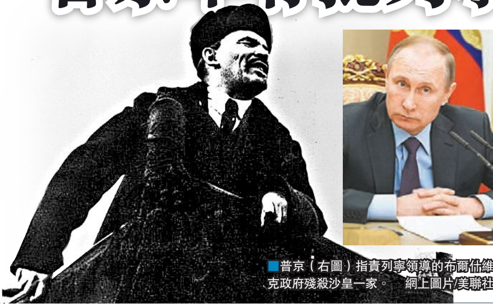
■普京（右圖）指責列寧領導的布爾什維克政府殘殺沙皇一家。

俄羅斯總統普京過往評論國家歷史時，一般態度審慎，以免冒犯選民，不過他前日罕有地公開批評蘇聯創立人列寧，認為對方當年劃定各加盟共和國界線時，為現今的俄羅斯埋下「計時炸彈」，又指責列寧領導的布爾什維克政府殘殺沙皇一家及數千名東正教神職人員。