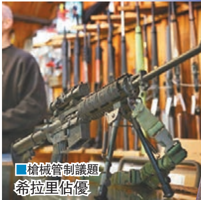
■槍械管制議題 希拉里佔優

CNN公佈的民調結果，結合美國4個由傳媒機構及大學舉辦的民調，顯示桑德斯和希拉里的支持率分別為46%及44%。CNN本月15日至21日亦進行自家民調，訪問有意出席黨團會議的民主黨支持者，發現51%傾向支持桑德斯，支持希拉里的只有43%，是桑德斯首次在CNN民調中超越希拉里。