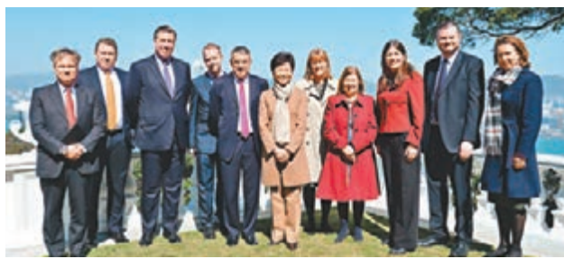
林鄭月娥與英國國會跨黨派中國事務小組成員代表團合影。

中國外交部早前在回應李波事件時強調，香港是中國的特別行政區，香港事務全屬中國內政，任何外國都無權干涉，「根據香港及中國法律，任何具有中國血統的香港居民、在中國或香港出生的人，以及其他符合中國國際法規定，具有中國國籍條件的人，都是中國公民。」