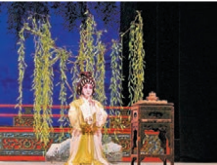
■王超群演袁姘拜月許願。