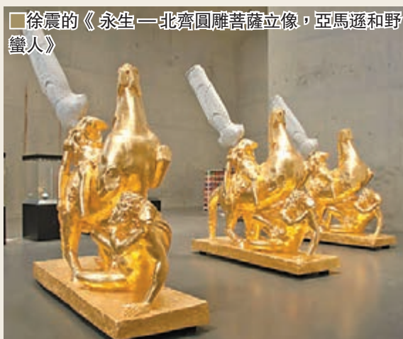
■徐震的《永生—北齊圓雕菩薩立像，亞馬遜和野蠻人》

城鄉關係的轉化。同時也反覆探討身份問題。精選系列並不能全面展示中國藝術現狀，但令我們得以關注在飛速發展下中國藝術創作種類繁多，形式多變的特色，至少能夠肯定這些潮流以及值得關注的個人風格。