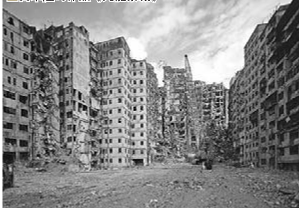
■曾家偉作品《新地標1》