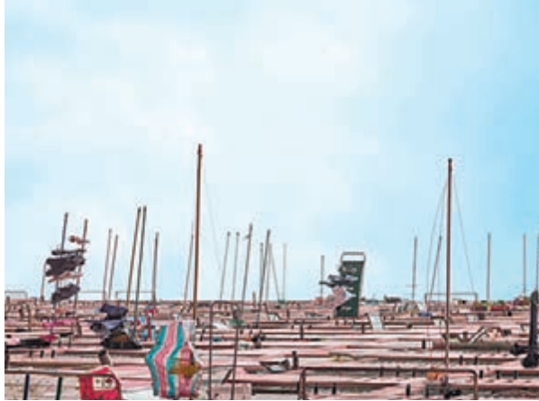
■李承熙的大型陶瓷裝置《朱陶竹林》