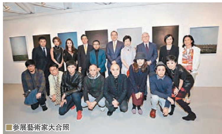
■參展藝術家大合照

黃：我覺得策展人就像個導演，要把作品處理在空間裡，就不可能讓所有的作品都很突出。一個電影裡不可能人人都是主角，需要有角色襯托主演，策劃展覽也是一樣，需要有大中小、有強有弱，有敘事，有節奏。策展工作是要突出藝術家作為「人」的角色，擺脫現存社會的既定束縛，充分探索「人」在藝術實踐中的可能性。異文化的相遇，不僅是在發現他人，同時也是自我的再發現，通過對話、協商、交流和分享最終創造新的價值。作為導演，我盡量要做到，讓這個展覽不枯燥，從多層次多面向展示東北亞蓬勃的藝術發展，加深觀眾的理解。錄像、裝置、攝影之間既有和空間的關係，又有作品與作品之間呼應。從某種意義上來說，策展是（藝術家）作品與觀者、作品與作品、作品與空間及語境的相遇和對話。