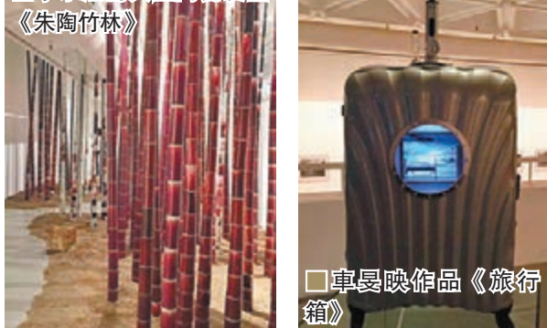
■車曼映作品《旅行箱》

術是飄移的，不應該被地緣、歷史所堵塞。換言之，藝術如同遊牧一樣能超越意識形態的界限。在當代藝術領域中，東北亞是一個複雜多元的空間。各自秉承傳統，又在現代化的發展中相交匯，使東北亞當代藝術走上了截然不同的生長路徑。《文化碰撞：穿越東北亞》是理想化的，我們想要分享藝術作品之間的對話和交流。通過敞開的空間安排，提出值得思考的問題。作品和作品之間對應，又能加深作品內在的深意。比如同為攝影作品，《九龍寨城》與《愛》在同一空間內遙相呼應。《九龍寨城》是攝影師宮本隆司以日本人視角觀察記錄1987年至1993年的九龍寨城，中國近代史的脈絡在畫面中悄然而立。而中國藝術家王國鋒五度深入朝鮮，把焦點對準朝鮮的慶典儀式，將一名女兵從千篇一律的軍人海洋中抽離，逐漸放大形成了《愛》。《九龍寨城》再現現實的同時，《愛》的集體無意識亦得到強化。