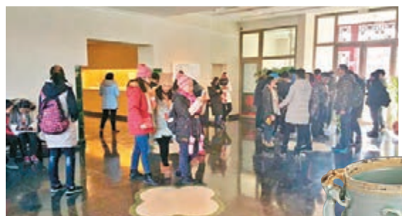
■預展已吸引不少古瓷愛好者入場參觀

麥溥泰又提及展覽的具體佈局，展覽按照時代分為唐、五代、北宋（含遼代）、金代、南宋和元、明幾個單元，各單元又以窯口將瓷器劃分為組，進而再以功能細分。展品材質以瓷器為主，輔以金、銀、銅器、漆器、石器、瑪瑙等，器類又以茶、酒器為重，兼及花器、香器與文具。他講：前部分結合學術，陳列以兩宋遼金古物為主，兼及唐至明各種窯口的器物，為考古提供實證。後半部分則是另一面貌，展示宋元時期的人文精神、文化生活、用器之道與工藝之美。主題陳列外另設計展陳了煎茶、點茶、酌酒、品