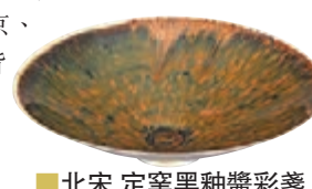
■北宋 定窯黑釉醬彩盞