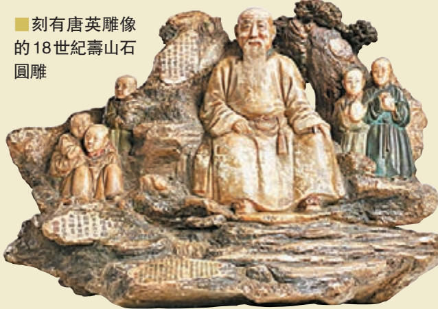
■刻有唐英雕像的18世紀壽山石圓雕