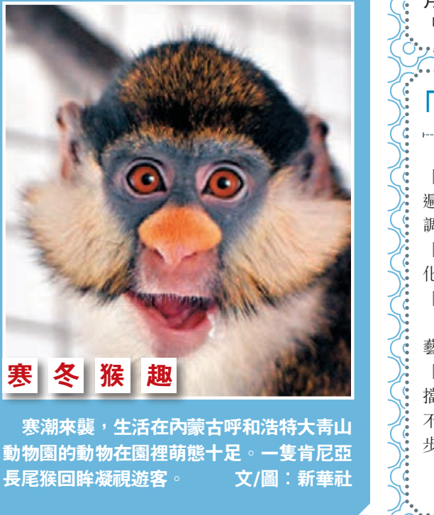
寒冬猴趣 寒流來襲，生活在內蒙古呼和浩特大青山動物園的動物在園裡萌態十足。一隻肯尼亞長尾猴回眸凝視遊客。