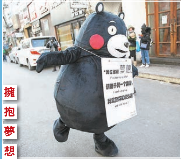
擁抱夢想 一隻萌熊昨日在北京極寒天氣中擁抱街頭來往的路人，希望用這種方式為人們的追夢路打氣加油。牠的身上掛着印有「我在追逐夢想，請給予我一個擁抱，我需要你們的支持」和「你是否拋棄了你的初心」的牌子。中新社