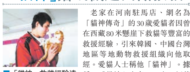
老家在河南駐馬店、網名為「貓神傳奇」的30歲愛貓者因曾在西藏80米懸崖下救貓等豐富的救援經驗，引來韓國、中國台灣地區等地動物救援組織向他求經。愛貓人士稱他「貓神」。據稱，「貓神」身高1.99米，經營至西藏。網上圖片 著一家淘寶貓糧店；曾在貴州當兵2年，最多養過80多隻貓。目前，他將營救重心放在江浙滬京等地。2007年，他通過QQ群獲悉，拉薩某寺院的母貓在懸崖產下5子，母貓能爬上懸崖，但小貓沒有這樣的能力。當地人曾試圖營救，都未成功，寺僧只能每天到懸崖邊給小貓們送食物。所幸，有愛貓之人願意贊助他往返拉薩機票，靠一根繩子，他完成了營救。香港文匯報實習記者 李楊 上海報道