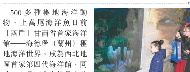
500多種極地海洋動物、上萬尾海洋魚日前「落戶」甘肅省首家海洋館——海德堡(蘭州)極地海洋世界，成為西北地區首家第四代海洋館，同時，也是西北海拔最高的海洋館。據了解，該海洋世界今日正式開館迎客。場館規劃設置了7大功能區，包括熱帶海洋區、河湖泊區、夢幻水母區、海底潛游區、冰河世紀區、沙灘海洋區、熱帶雨林區。各區各具特色，為遊客營造一個妙趣橫生的海洋世界。香港文匯報記者 王岳、李燕華 蘭州報道