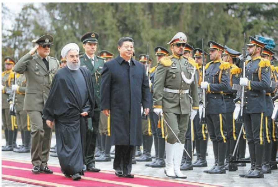
■習近平在魯哈尼陪同下檢閱儀仗隊。