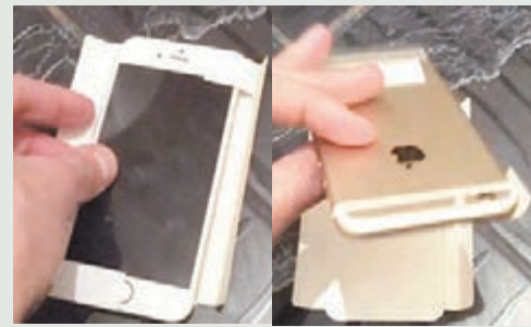
9to5mac則指影片中的新iPhone揚聲器大小與4.7吋屏幕版相若，故不肯定新iPhone較小。

中國移動早前曾表示，iPhone 7c將於3月推出，是首次提到新iPhone名稱。蘋果據報將於3月發佈會推出新智能手錶Apple Watch 2，並先推