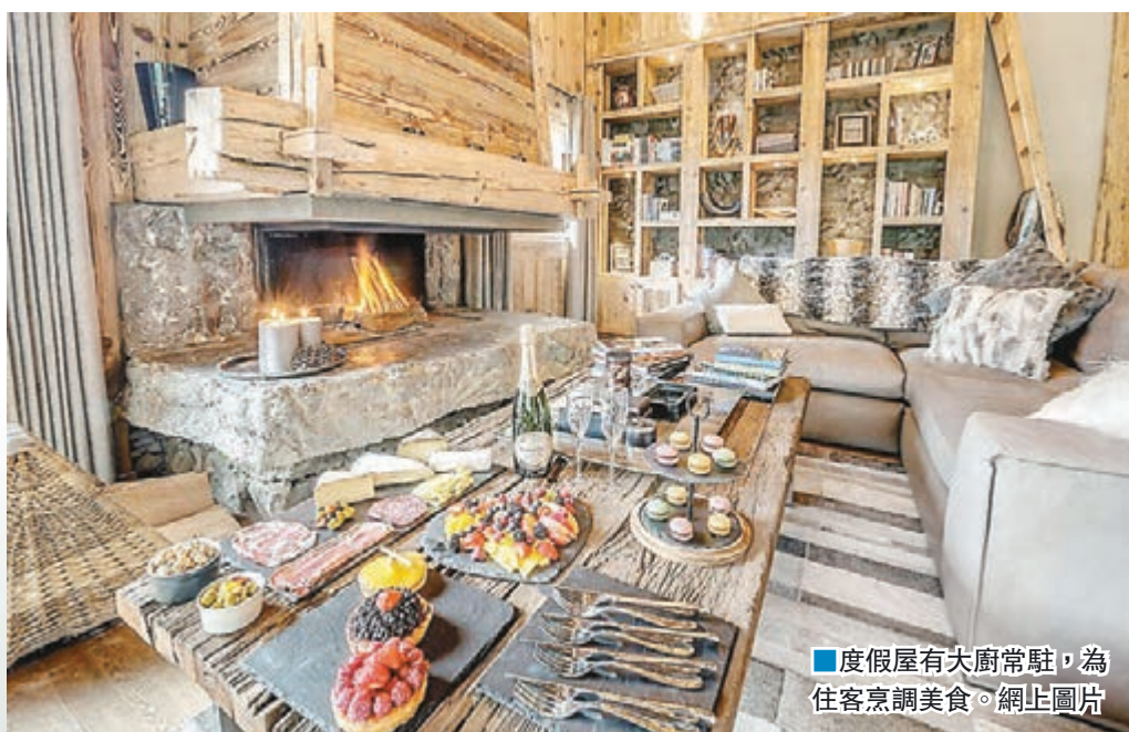
度假屋有夫廚常駐，為住客烹調美食。網上圖片