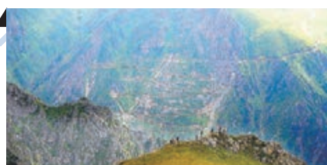
撞欄，駕駛者一不小心便會墮下數百米懸崖，然而當地人仍會使用此路作日常運輸。 ■《每日郵報》

成，全長106公里，共有29個「髮夾彎」，最高點位處海拔2,035米。網站形容，D915公路部分彎位太窄太急，難以一下子轉過，部分路段在冬天因結冰而變得濕滑，需要封閉。公路沒設警告牌及防