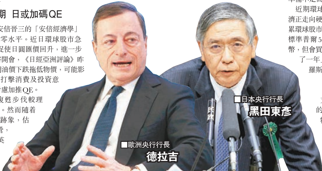
歐洲央行行長 德拉吉