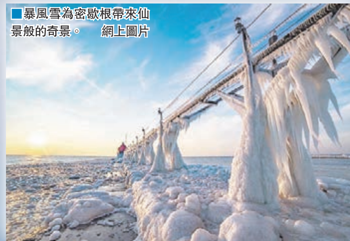
暴風雪為密歇根帶來仙景般的奇景。網上圖片