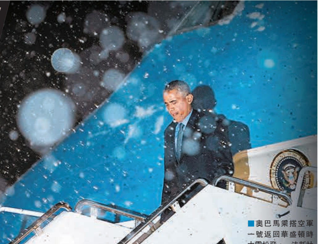
奧巴馬乘搭空軍一號返回華盛頓時大雪紛飛。