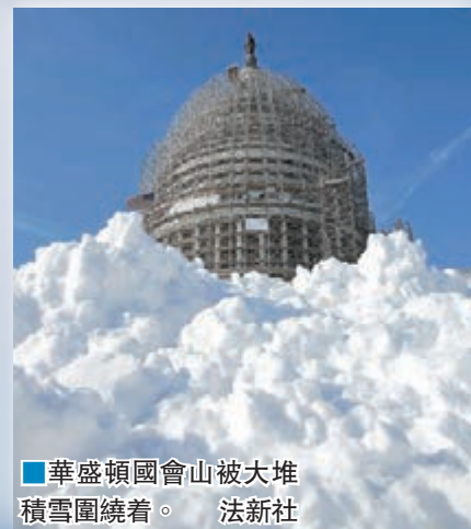
華盛頓國會山被大堆積雪圍繞着。