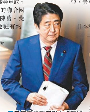
安倍在施政演說中將韓國定位為最重要鄰國。

澳洲洛伊國際政策研究所專家海沃德一瓊斯指，斐濟總理姆拜尼馬拉馬2006年政變上台後，澳洲、新西蘭及美國等傳統盟友實施軍事及經濟制裁，斐濟為擺脫孤立，與中國及俄羅斯等國家加強關係。安全問題專家布坎南指，斐濟尋求外援，與中俄近年致力增加亞太地區影響力不謀而合。