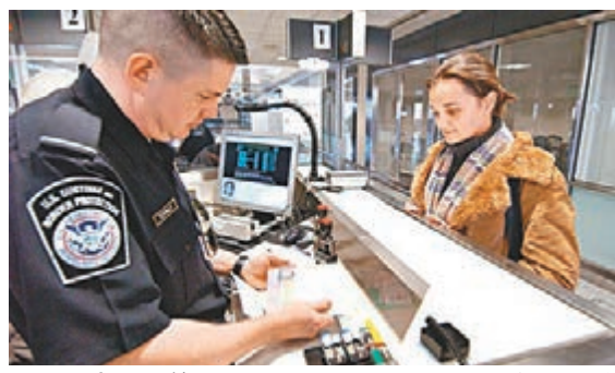
美國實施免簽新措施。

美國國務院前日宣佈，即日起實施免簽新措施，取消兩類人士的免簽待遇，包括2011年3月1日起到