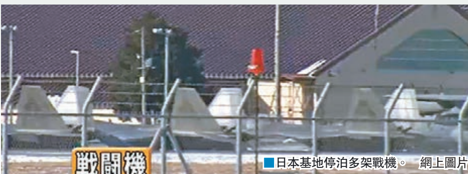
日本基地停泊多架戰機。