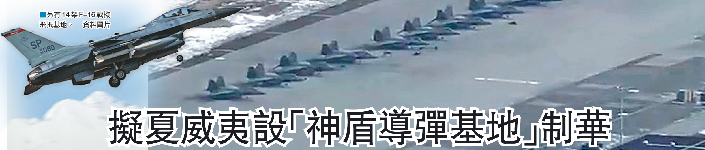
另有14架F-16戰機飛抵基地。資料圖片