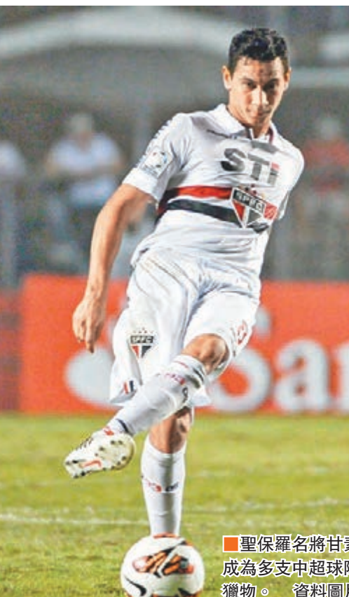
聖保羅名將甘素成為多支中超球隊獵物。資料圖片