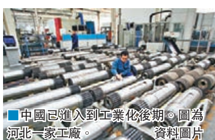
中國已進入到工業化後期。圖為河北一家工廠。資料圖片

黃群慧強調,到2020年基本實現工業化,並不意味著工業化的終結,當今整個世界仍處於工業化時代,美國等發達國家也在提再工業化,因為工業生產能