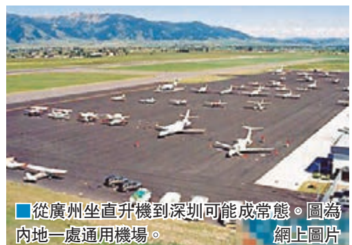
從廣州坐直升機到深圳可能成常態。圖為內地一處通用機場。

記者從規劃中看到,廣州要打造兩個服務聚集區。其中,中部聚集區將構建通用航空金融服務平台,發展成為內地重要的通用航空現代金融服務中心。東北部聚集區則主要依托從化溫泉、增城森林公園等旅遊資源,打造航空休閒高地,重點開展直升機、熱氣球等空中遊覽、飛行體驗項目,探索空中綠道旅遊,與陸上、水上綠道形成三位一體的3D綠道新體驗,形成多條特色低空旅遊線路。