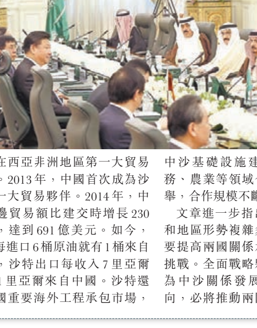
習近平同沙特阿拉伯國王薩勒曼舉行會談。

高水平、更寬領域、更深層次跨越，更好造福兩國人民。中沙要做相互支持、真誠互信的戰略夥伴，加強國家發展戰略對接，在涉及彼此核心利益和重大關切問題上相互理解和支持，鞏固政治互信；要做合作共贏、共同發展的互惠夥伴，擴大雙邊貿易規模，打造長期穩定的中沙能源合作共同體，加強基礎設施建設、投資領域合作，並以航天、和平利用核能、可再生能源三大高技術領域爲突破口，豐富中沙務實合作內容；要做同舟共濟、攜手同行的合作夥伴，在共同推進絲綢之路經濟帶和21世紀海上絲綢之路建設的框架內深入合作；要做往來密切、交流互鑒的友好夥伴，擴大教育、新聞、智庫、青年等領域交流合作，加強各層次人文交流。