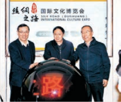
甘肅省委副書記歐陽堅(中)，甘肅省委常委、宣傳部部長連輯(左)，甘肅省政協副主席栗震亞啓動開通絲綢之路(敦煌)國際文化博覽會官網。

香港文匯報訊(記者 肖剛 蘭州報導)文化聖殿，人類敦煌。絲綢之路(敦煌)國際文化博覽會官方網站(中文網址為http://www.silkroaddunhuang.com/; 英文網址為http://www.silkroaddunhuang.org/)和「兩微一端」日前開通。採用先進阿里雲服務器的官網和「兩微一端」，旨在依托互聯網全面展示絲綢之路沿線國家和地區文化藝術，以推動不同區域文化交流、互利共贏與合作發展，為文博會參與者提供全方位信息服務，打造永不落幕的網絡敦煌國際文博會。