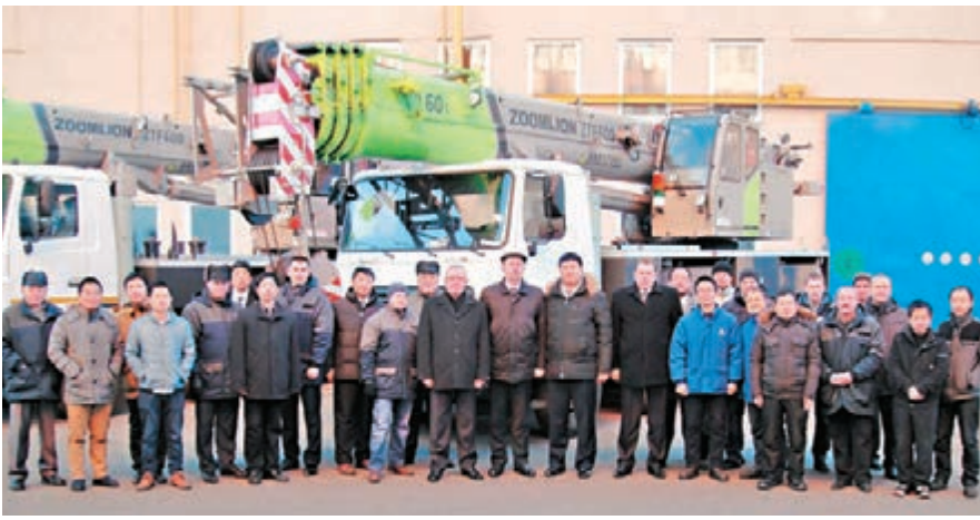
中聯重科中白工業園新產品下線。

據中聯重科白俄小組相關負責人介紹，中聯重科以期將中白工業園打造為未來海外本地化組裝的範本。