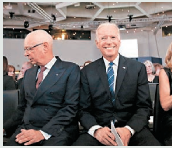
■ 拜登(右)打頭陣演講，闡述美國將加快認可具潛力的「雞尾酒療法」新藥物。