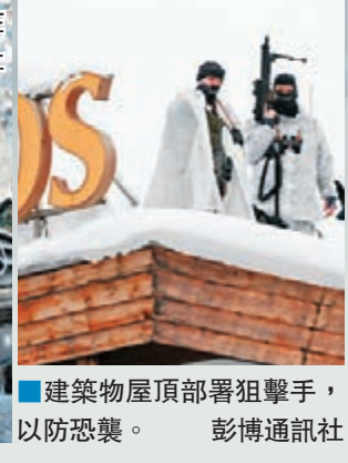
■ 建築物屋頂部署狙擊手，以防恐襲。