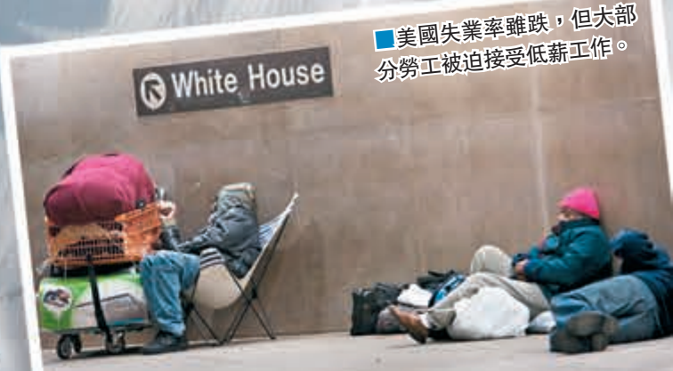
■ 美國失業率雖跌，但大部分勞工被迫接受低薪工作。