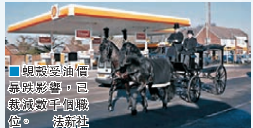
■ 蜆殼受油價暴跌影響，已裁減數千個職位。

伊朗石油輸出解禁拖累國際油價昨日繼續下跌，紐約期油昨日低見每桶27.54美元，為13年