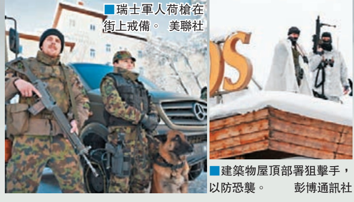
■ 瑞士軍人荷槍在街上戒備。