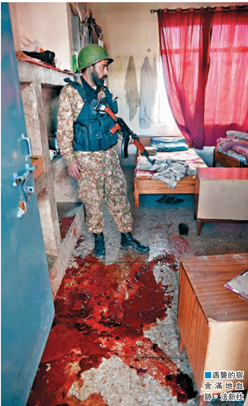
遇襲的宿舍滿地血跡。