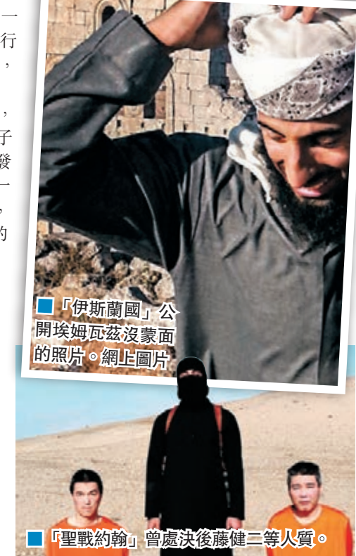
「伊斯蘭國」公開埃姆瓦茲沒蒙面的照片。

英國蘭開夏郡一名10歲穆斯林男童，因誤將「排屋」(terraced house)串錯成「恐怖分子住所」(terrorist house)，老師大驚下報警求助，令男童無辜被警方拘捕及盤問，因此遭受心理創傷，至今不敢寫字。他的家人要求老師和警方道歉。事發上月初，當時男童在英文課上寫錯字，老師信以為真，遂根據去年通過的反恐法報警。警方拘捕男童，並檢查他家中的一部手提電腦。男童表姐稱，男童一家起初以為是惡作劇，「你可以對一個30歲男子這樣做，但不能這樣對一個小男孩」。 ■《衛報》