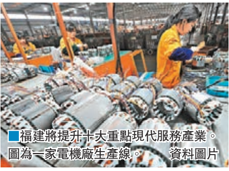
福建將提升十大重點現代服務產業。圖為一家電機廠生產線。

香港文匯報訊（記者 蘇榕蓉 福州報導）改變以傳統製造業為主的經濟發展模式為發展現代服務業，這是目前提升福建經濟產量和產業結構的一個有效方式。近日，福建省出十大舉措提升現代服務業的若干意見（下稱《意見》），提出加強規劃引導、着力發展重點領域、深化改革和對外開放等十方面對策措施。