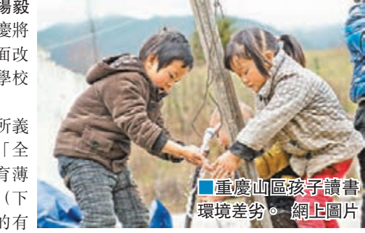
重慶山區孩子讀書環境差劣。

此外，近幾年重慶每年新補充中小學教師8,000名左右，建成教師周轉宿舍1.2萬套，為10.4萬名鄉村教師發放崗位生活補助，市級培訓中小學骨幹教師6萬人，為1萬名中小學教師配備了筆記本電腦。