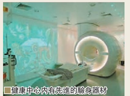
健康中心內有先進的驗身器材

拉提醫美最吸引是無傷口，無恢復期，拉提肌膚緊緻效果不似打肉毒桿菌或玻尿酸快見效，要兩三個月漸漸變靚。流行打的美容針一般半年就失效，事實上這些物質留在身體太久也不宜。做超音波拉提，一般女性多做全臉部打500針，需時45分鐘以上，醫生說如果想慳錢打250針就不如不打了，一次音波拉提治療緊緻效果可維持一年半至二年。