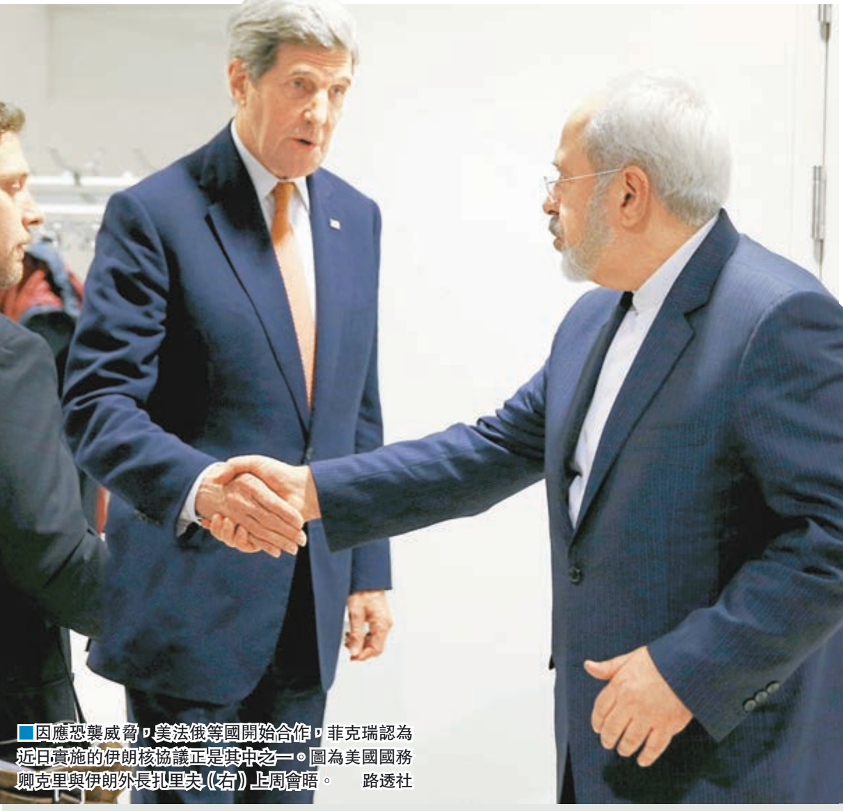
因應恐襲威脅，美法俄等國開始合作，菲克瑞認為近日實施的伊朗核協議正是其中之一。圖為美國國務卿克里與伊朗外長扎里夫(右)上週會晤。

近年中東局勢動盪，適逢中國國家主席習近平展開對沙特阿拉伯、埃及和伊朗的國事訪問，外界關注習近平此行可以為中東局勢帶來哪些影響。伊朗駐港總領事菲克瑞(Mehdi Fakhri)博士向本報表示，中國在伊朗與沙特之間居中斡旋，將對中國國內穆斯林產生正面影響，亦有助中國在國際事務上扮演新角色，不過關鍵仍在於區內大國能否有效合作。 ■香港文匯報記者 余家昌