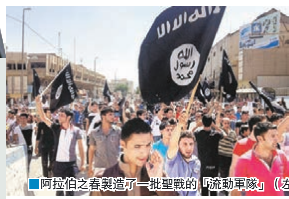
阿拉伯之春製造了一批聖戰的「流動軍隊」(左圖)。右圖為敘利亞準備彈藥打擊「伊斯蘭國」。

來新低。美股高開160點。中國去年經濟增長6.9%，雖然是1990年以來最低增速，但大致符合7%預期增長目標，市場憧憬中國未來可能推出更多刺激經濟措施，帶動昨日環球股市上升，美股亦高開過百點。道瓊斯工業平均指數昨早段報16,148點，升160點；標準普爾500指數報1,893點，升13點；納斯達克綜合指數報4,532點，升44點。歐股全線上揚，英國富時100指數中段報5,883點，升103點；法國CAC指數報4,275點，升85點；德國DAX指數報9,678點，升156點。 ■《泰晤士報》/《每日電訊報》/法新社