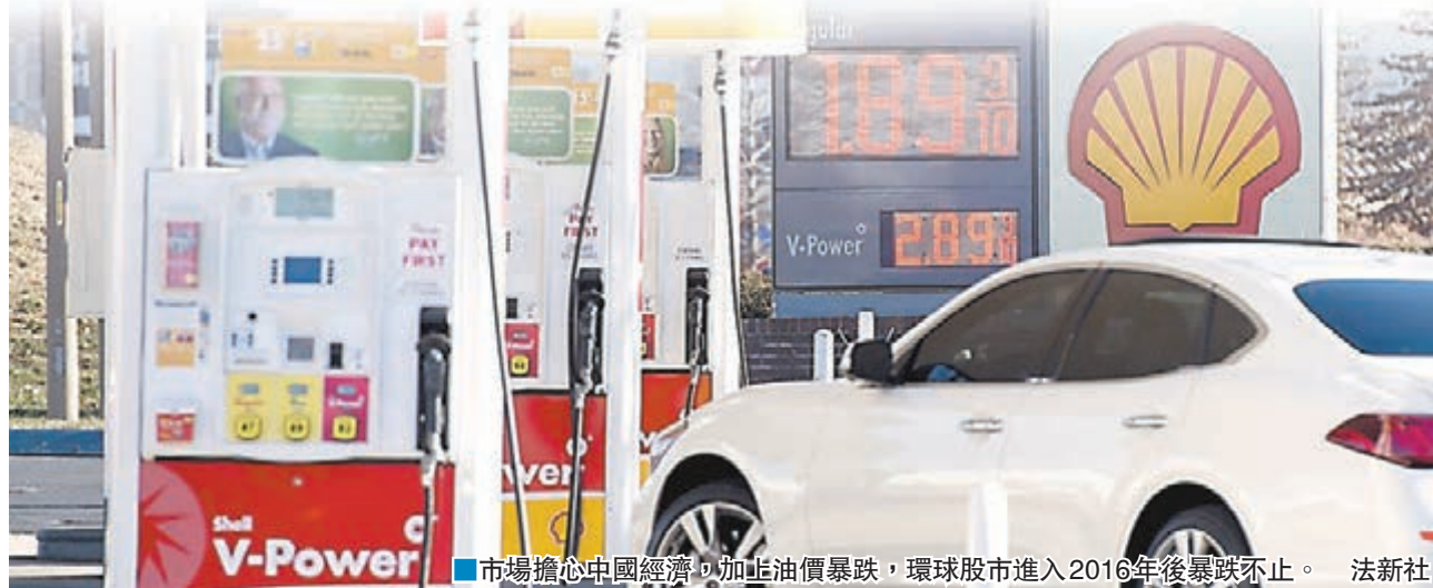
■市場擔心中國經濟，加上油價暴跌，環球股市進入2016年後暴跌不止。