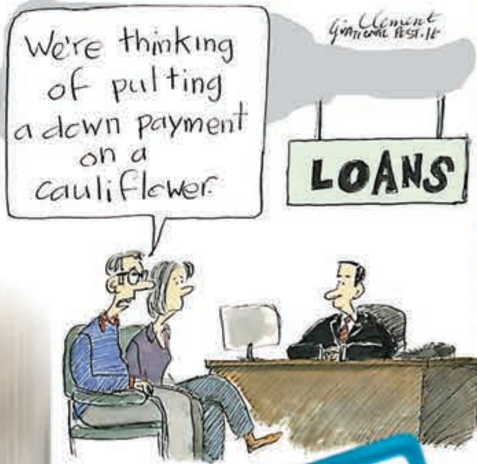
■加拿大漫畫呻捱貴貨：「我們想買椰菜花，打算申請分期付款。」