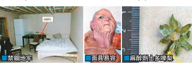
禁錮地牢 面具易容 麻醉劑士多啤梨

瑞典斯德哥爾摩一名醫生用沾有麻醉劑的士多啤梨迷暈一名女子後，帶她到其560公里外的住所，其間為她及自己戴上鬍鬚男子及老婦易容面具掩人耳目，回家後將她禁錮在地牢近一周，多次強姦她，最後更企圖把她當作長期性奴，但事敗被捕，被控以強姦及非法禁錮等罪名。