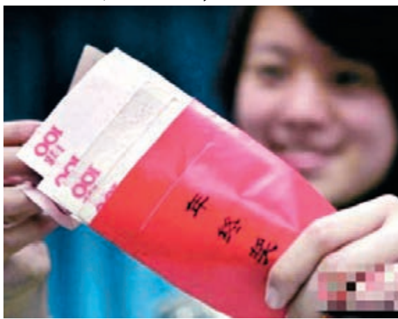
《中國青年報》日前調查發現，過半數打工仔年終獎不足5,000元人民幣。資料圖片

香港文匯報訊 據中社社報，年關將近，奮鬥了一年的打工仔紛紛將目光投向年終獎。《中國青年報》日前調查發現，過半數人年終獎不足5,000元(人民幣，下同)，42.7%的人年終獎較2014年減少。另一項調查顯示，一線員工離職率最高，離職原因大多是薪資。