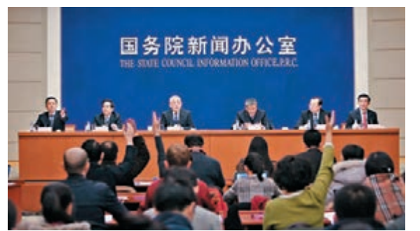
中紀委5名高級官員集體亮相新聞發佈會，解讀十八屆中紀委第六次全會精神，並答記者問。

此外，他還指出，中國公民移居其他國家，依然保持中國戶口，根據國際法及中國出入境管理法的規定，這些人依然是中華人民共和國的公民，如果有經濟犯罪，就要受到「天網」行動下「獵狐」行動的緝捕；如果這些人是中共黨員或者國家工作人員，在整個「天網」行動下對其的緝捕，不構成任何障礙。