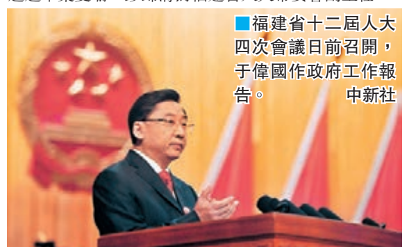
福建省十二屆人大四次會議日前召開，于偉國作政府工作報告。

于偉國在福建曾分管或主管過經濟、黨務、組織人事等，綜合能力和黨政經驗有獨到之處。此外，福建省十二屆人大四次會議第三次全體會議選舉舉雙璩、彭錦清為福建省人大常委會副主任。