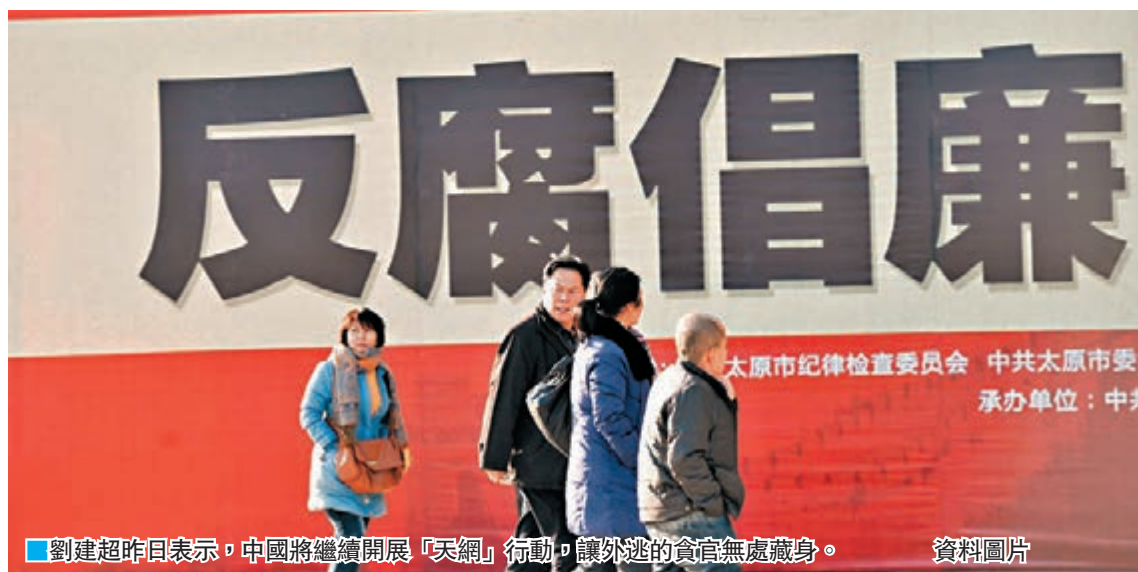
劉建超昨日表示，中國將繼續開展「天網」行動，讓外逃的貪官無處藏身。

此外，吳玉良還向中外記者介紹，去年全黨被給予黨紀政紀處分人數及受到審查的中管幹部人數均創改革開放歷年來的最高值，共處分33.6萬人，涉嫌違紀的中管幹部結案處理和正在立案審查的90人，其中42人被移送司法，十八大以來查處的中管幹部覆蓋了31個省區市。不過他強調，中國共產黨擁有8,700萬黨員，是世界上最大的政黨，雖說被查出的黨員幹部達到33萬人，但8,700萬的分母一算，比例是很小的，「出問題的幹部總歸是少數，大多數主流是好的，這道算術題還要算明白。」