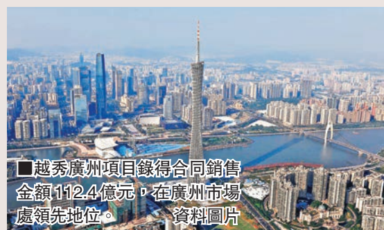
越秀廣州項目錄得合同銷售金額112.4億元，在廣州市場處領先地位。資料圖片

香港文匯報訊 越秀地產(0123)公佈，2015年全年合同銷售金額248.5億元(人民幣，下同)，同比增長13%，順利完成2015年全年銷售人民幣248億元的目標。累計合同銷售面積約227.2萬平方米，同比上升約20%。2015年12月單月錄得合同銷售金額約27.9億元，同比升約55%，環比升約23%；合同銷售面積約24.9萬平方米，同比升約92%，環比上升約15%。