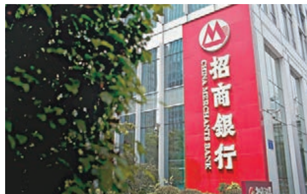
招商銀行連續12年成最青睞的內地私人銀行。

胡潤百富調研數據顯示，截至去年5月，內地約有121萬名千萬富豪，較2014年增加了12萬人，其中億萬富豪人數為7.8萬名，較上年增加1.1萬名。10億美元富豪去年達到596位，首次超越美國，創下歷史新高。