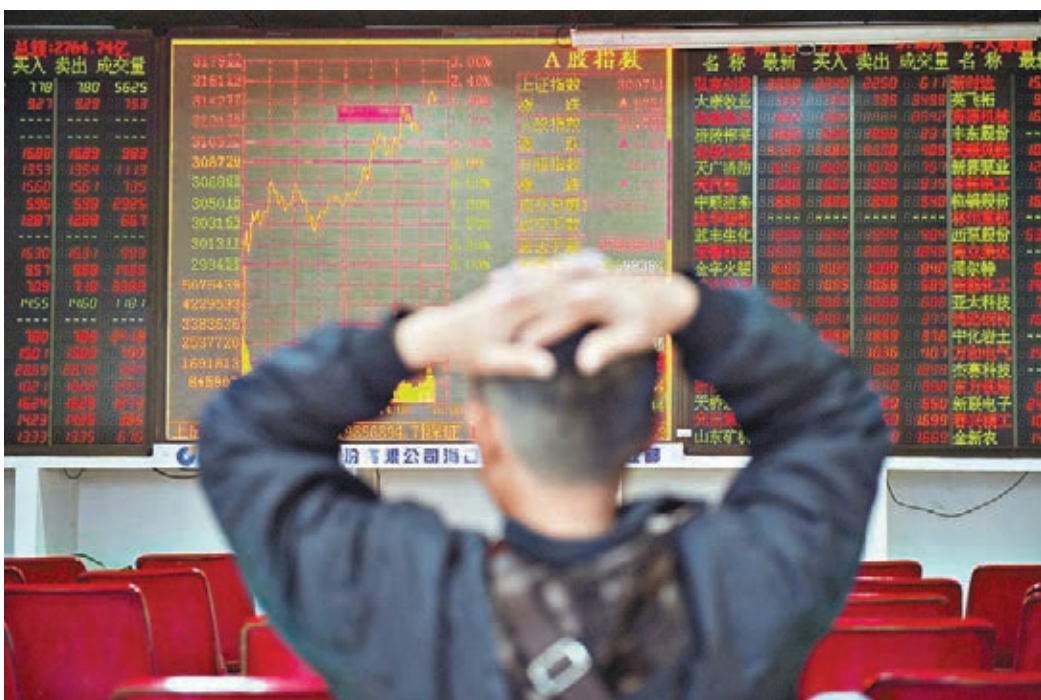
昨午後受部分上市公司聯合倡議增持消息的影響，重燃做多熱情，滬指最終反彈1.97%。

華融證券則提到，目前市場對於探底、還是見底，存在一定分歧，雖然人民幣匯率貶值、新股擴容超預期、大股東減持等因素正在逐一緩解，但由於前期暴跌導致公募贖回、分級下折和私募清盤等負面因素仍沒有消除。該機構指，經過前期暴跌之後，市場估值已趨於合理，底部正在趨近，但即便後期利好政策出台，市場大概率是U形走勢，而非V形走勢，這也決定了操作方式，短期不急於佈局，不妨等市場底部平台穩固後再擇機選擇優質個股。