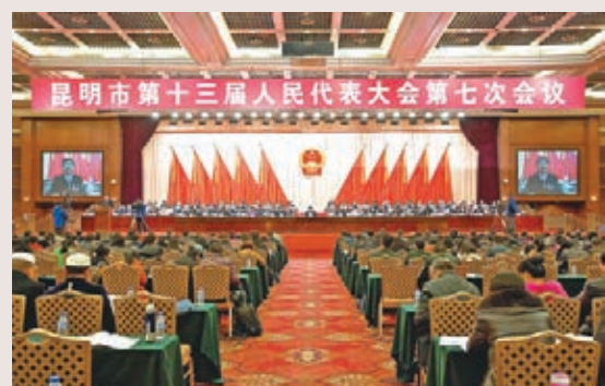
昆明市第十三屆人民代表大會第七次會議開幕。

香港文匯報訊(記者王晉昆明報道)昆明市第十三屆人民代表大會第七次會議13日開幕。昆明市代市長王喜良作的政府工作報告中顯示，2015年，全地區生產總值預計完成4,000億元人民幣，增長8%。