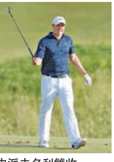
史派夫名利雙收。

可口可樂周三宣佈與現任高爾夫球世界「一哥」史派夫簽約,未來數年將為品牌擔任代言人,在電視廣告、社交媒體和產品包裝上出現。現年22歲的史派夫目前在高爾夫界炙手可熱,在日前出版的《高爾夫文摘》中,以5300萬美元(包括贊助和比賽獎金總收入成為去年的高球「吸金王」,商業價值首屈一指。