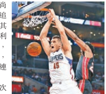
高爾艾德列(左)臨危受命,交足功課。

勇士後衛基利湯遜在尚餘3.4秒時投進3分球,追至僅落後1分,然而金塊其後投入1個罰球,加上基利湯遜最後一擊射失3分球,結果勇士以2分之差飲恨,今季錄得第3場敗仗,7連勝告一段落。 史提芬居里全場共有8次失誤,賽後他談到最後一次失誤時說:「這是一次大好機會嘗試追平或領先,但在控球及找在空位的隊友之間被堵住,有點失手便被加連拿利奪走。」加連拿利是役取得全隊最高的28分,而另一前鋒韋爾巴頓後備上陣亦貢獻21分,成為金塊擊敗勇士的最大功臣。