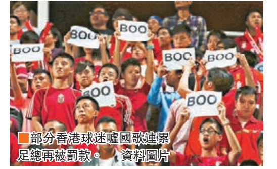
部分香港球迷噓國歌連累足總再被罰款。 資料圖片

對國足噓國歌 足總再遭罰款 另外,足總昨日發表聲明表示,近日獲國際足協正式通知,就去年11月17日於香港舉行港足主場對國足的世界盃外圍賽中,再發生球迷噓國歌事件,國際足協向足總罰款1萬瑞士法郎(約7.8萬港元),以及作出警告。 足總在新聞稿指出,國際足協決定引用規條第67條,向足總罰款1萬瑞士法郎。國際足協並根據《國際足協紀律章程第13條》警告足總於將來比賽不能再犯該些不當行為,否則可能面臨更嚴重的處分。足總亦於新聞稿中再次呼籲球迷在未來的比賽保持克制,以免足總及代表隊遭受更嚴重處分。 足總已因為在去年9月主場對卡塔爾一役,有球迷擲雜物入球場及噓國歌,結果被國際足協罰款5千瑞士法郎,而去年6月主場對不丹亦因為球迷噓國歌,國際足協曾對足總作出警告。