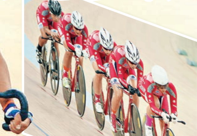
港隊爭奪女子團體追逐賽奧運資格。 郭正謙攝