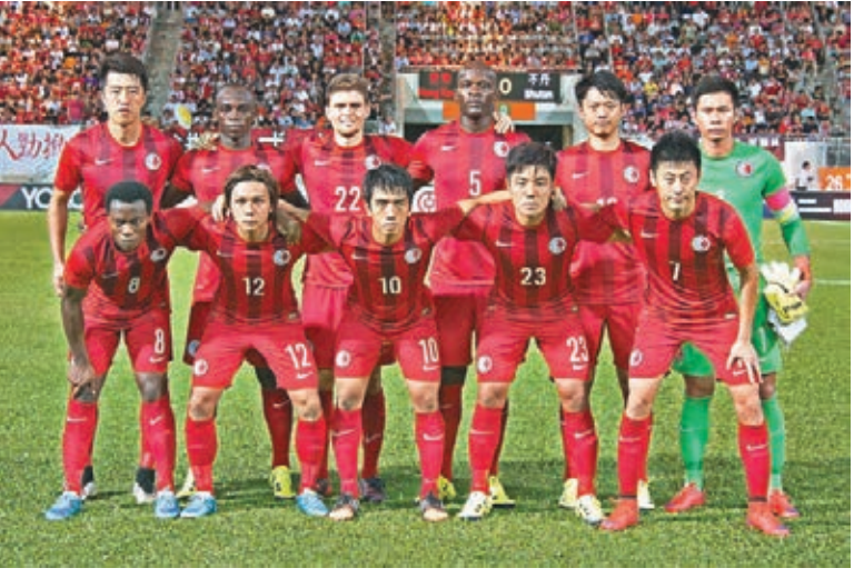
港足將在大年初二與港聯賀歲。