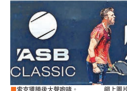
索克獲勝後大聲咆哮。

美國男網球手索克昨日在奧克蘭精英賽8強賽事,以總盤數2:1反勝全場共發出14個「Ace球」的南非球手安達臣,躋身準決賽,賽後這名23歲球手脫去一隻襪子送給現場球迷。 索克在先失首盤1:6的劣勢下,連贏2盤6:4,成功逆轉世界排名較自己高14位的安達臣,下場將挑戰頭號種子、西班牙球手費拿,爭入決賽。索克驚險反勝出線,賽後高興得脫去一隻襪子送給現場球迷慶祝,對此他說:「我認為我擁有這麼特別的名字(Sock),應該開始一個新慣例,如果我勝出,就送出一隻襪子。我轉了個圈便拋出襪子,我認為需要走到球場拿着,看看我真的想要一隻汗濕的襪子。」