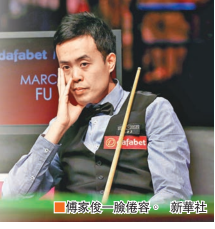
傅家俊一臉倦容。